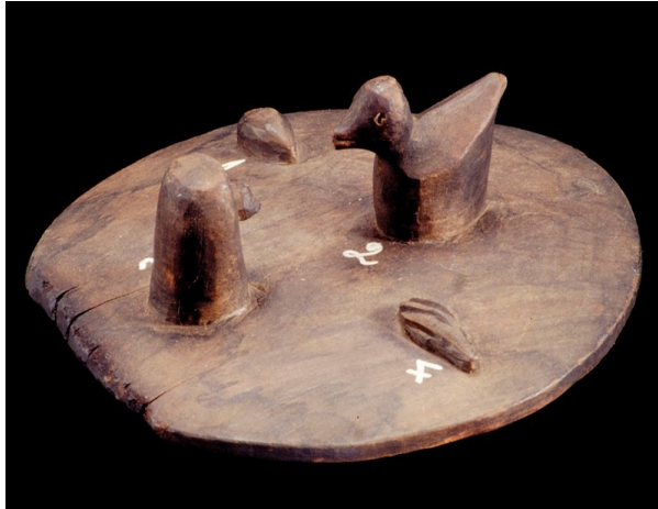
Fig. 1 - Testo oferecido pela mulher ao marido. MAUC. D.84.1.390

Para explicar e definir o conceito desta forma de correspondência na sociedade e cultura Woyo tradicional tornou-se essencial compreender o paradigma subjacente àquela prática de representação, ou seja, avaliar quais os símbolos utilizados e as convenções do seu funcionamento enquanto sistemas de comunicação. Um facto se destacava recorrentemente: a utilização sistemática de motivos plásticos seguidos da respectiva associação ao provérbio ou provérbios que estabeleciam a interpretação dos conceitos.