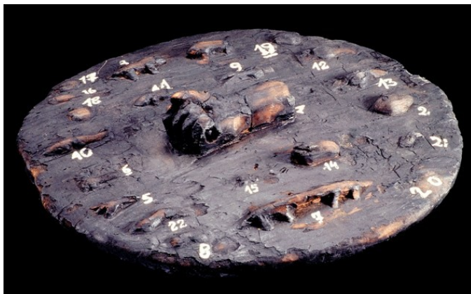
Fig. 2 – Testo oferecido pelo homem à mulher, parcialmente queimado. “R” MAUC. D.84.1.224

dos que tivemos ou vimos. Para facilidade de identificação indicamo-los, no presente estudo, com “R” (Representativo), logo a seguir ao seu número de ordem... Para se “parecerem” com os originais entregámo-los às cabindas, e também aos alunos da Missão. Mas não foram tão cuidadosos como as suas avós, nem estavam acostumados a usá-los; por isso alguns sofreram os efeitos do calor e do fogo. Depois a pressa em os tornar “parecidos” com os originais deu, como resultado, ficarem alguns um pouco queimados (Vaz, 1969: 27). (Fig. 2).