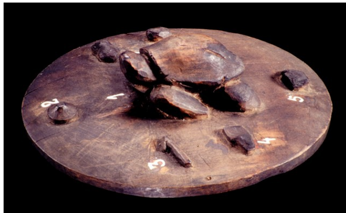
Fig. 4. Testo oferecido pela família à filha. MAUC. D. 84.1.209.

Estes são os dados e recursos que elucidam os fundamentos da oferta de testos ou tampas de panela na sociedade Cabinda: Explicamos o testo. Fazemos a sua leitura, ligando entre si os vários provérbios, à semelhança de uma carta com introdução, parágrafos e saudação final (Vaz, 1969:32).