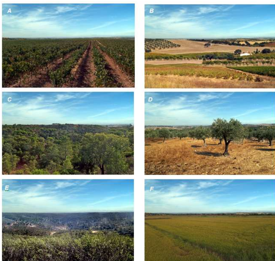
Figura 1 Exemplos de fotografias utilizadas como suporte visual para a aplicação do inquérito, representando as ocupações do solo mais representativas da região do Alentejo (A-Vinha; B-Mosaico; C-Floresta mista; D-Olival tradicional; E-Matos altos em terra florestal; F-Arrozal)

complexa a definição e distinção de diferentes ocupações (Pinto-Correia et al. , 2011). A manipulação digital de fotografias, criando condições atmosféricas semelhantes e eliminando elementos que perturbem ou influenciem a atenção do observador (Barroso et al. , 2011), permite a representação de paisagens facilmente reconhecidas pelo observador, como exemplificado na Figura 1. O segundo aspecto prende-se com a utilização da ocupação do solo para representar diferentes paisagens. A ocupação do solo é a componente da paisagem que, sendo directamente influenciado pelas actividades humanas, principalmente pela actividade florestal e agrícola (Pinto-Correia & Primdhal, 2009), melhor representa a paisagem rural. A ocupação do solo pode, além do mais, ser a base para a integração de dados de preferências de paisagem numa abordagem territorial.