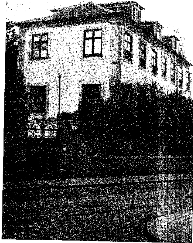
Fig. 1 Edifício da antiga Faculdade de Letras ( Quinta Amarela ) (ao Carvalhido)