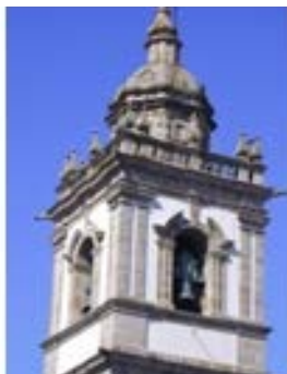
S. Vicente – Braga – 1742