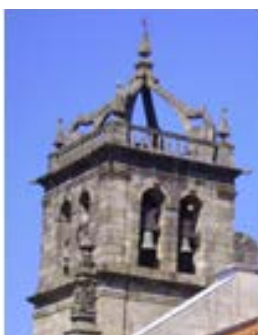
Sé – Braga – 1723