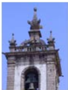
S. Domingos de Amarante – 1692