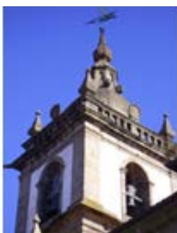
Terceiros, S. Francisco – Braga – 1723