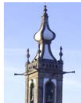
Stº António – P. Lima – Séc. XIX