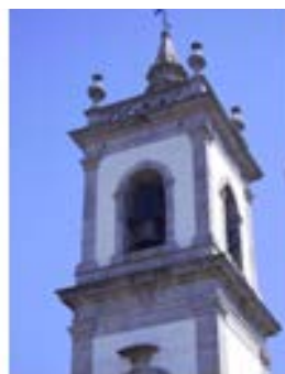
Maximinos – Braga – 1795