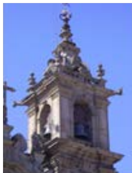
Stº Cruz – Braga – 1735