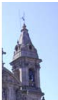
S. Marcos – Braga – 1787