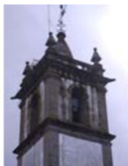
Esp. Santo – Arcos de Valdevez – 1725