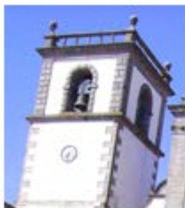
S. Domingos – V. Castelo – 1707