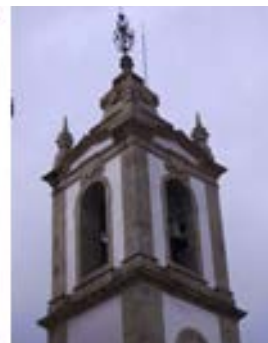
Lapa – Arcos de Valdevez – 1762