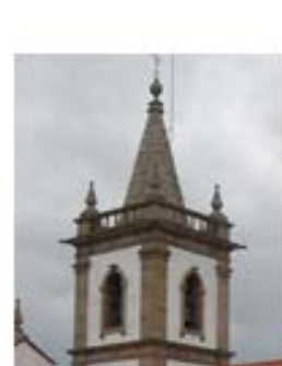
Matriz – P. da Barca – 1728