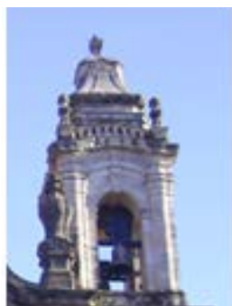
Congregados – Braga – 1762