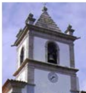
Bom Jesus de Fão – Esposende – 1710