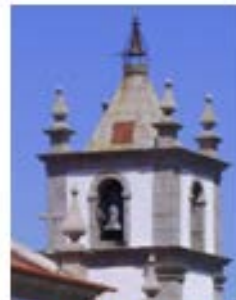
Rio Mau – Vila Verde – 1719