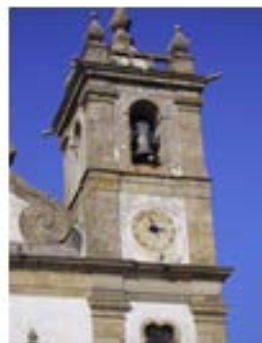
Matriz – P. Varzim – 1742