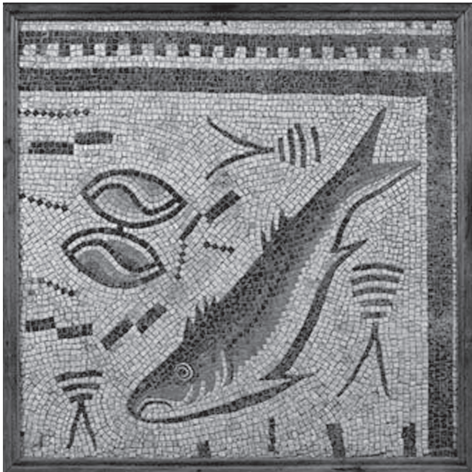
Fig. 1 - Mosaico de Panxón. ( http://carltonhobbs.com/viewAlternative.asp?StrReference=9127 )