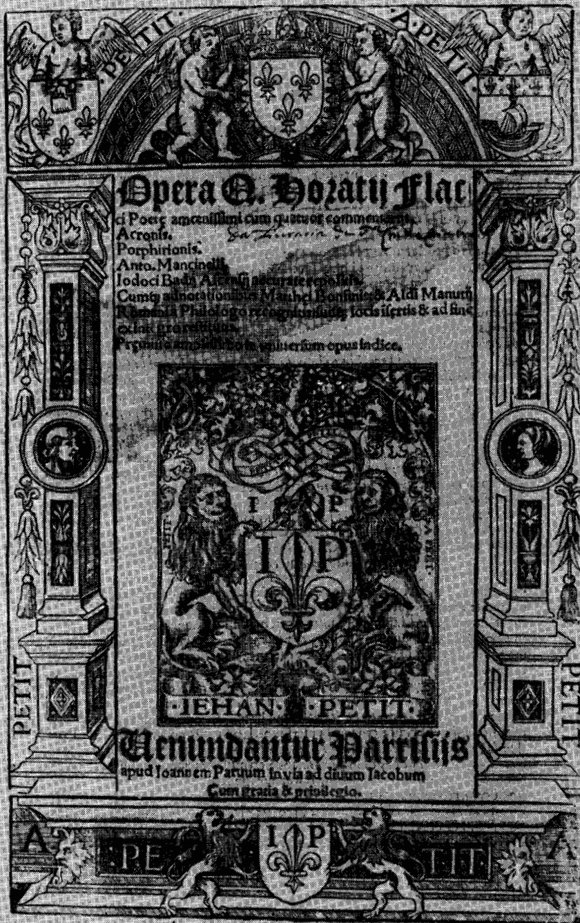
GRAYURA NOVE (Horácio, Opera , 1528; pertencentes manuscritos, no rosto: Liuraria de S.ta +... , o mais antigo; posterior, embora também quinhentista: Da Liuraria de S.ta Cruz de Coimbra ).