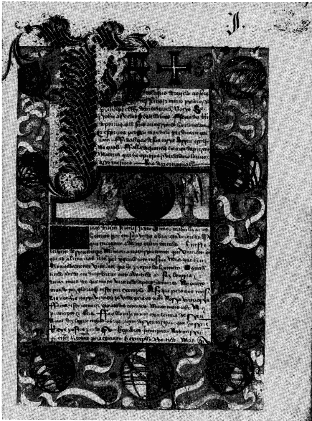
GRAVURA SEIS (nota oito).