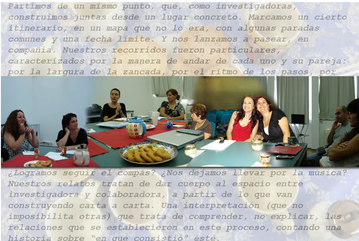
Figura 3. La mesa en la presentación del DEA. Data: Junio 2009. Local: Facultat de Belles Arts – Universitat de Barcelona.