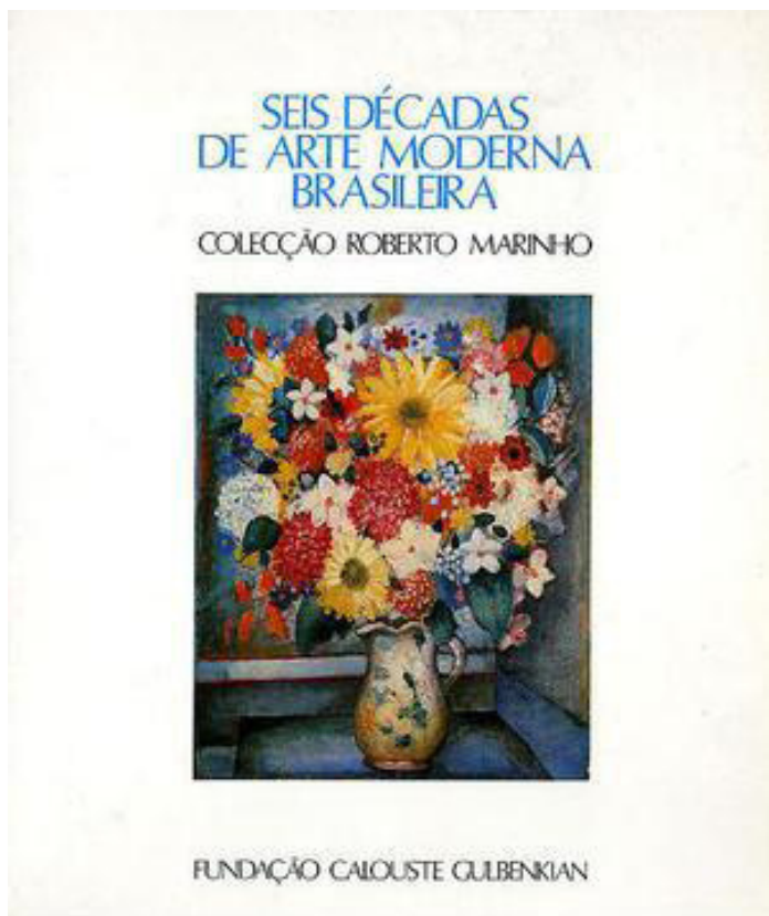
Figura 1. Capa do catálogo da exposição Seis décadas de arte moderna brasileira . Coleção Roberto Marinho , Centro de Arte Moderna José de Azeredo Perdigão, Fundação Calouste Gulbenkian, 1989

Estes núcleos foram organizados anteriormente através do estudo da coleção por especialistas, críticos, historiadores e técnicos de catalogação e conservação. Foram identificados sete núcleos bem definidos e com base a esta divisão a coleção se apresentou na Gulbenkian, de maneira como anteriormente já havia sido exposta no Museo Nacional de Bellas Artes de Buenos Aires e no Rio de Janeiro.