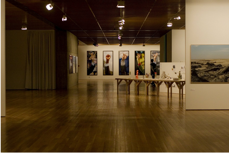
Figura 5. Vista da exposição Atlas de Acontecimentos , apresentada na Fundação Calouste Gulbenkian dentro do Fórum Cultural O Estado do Mundo , 7 de outubro a 30 de dezembro de 2007

Utilizando o princípio Atlas , inspirado nos conceitos de Aby Warburg, a mostra trazia produções realizadas em diferentes contextos, que ainda não fosse abrangente e com cunho totalizador, dava referências para entender a sistematização da arte não central e pretendia suscitar no público encontros sobre as verdades construídas para condições que se encontram além de nossas vivências. Sem distinções territoriais –situando toda a produção em um mesmo patamar- o conjunto de vinte e oito artistas pertencia a todos os rincões, incluindo brasileiros e de outros países da América Latina.