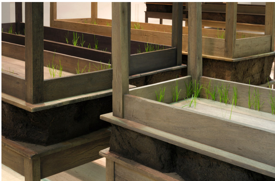
Figura 4. Vista da instalação Plegaria Muda da artista colombiana Doris Salcedo. Centro de Arte Moderna José de Azeredo Perdigão, Fundação Calouste Gulbenkian, 09 de novembro de 2011 a 22 de janeiro de 2012 © Doris Salcedo, CAM

de 2012. Centro de Arte Moderna José de Azeredo Perdigão). Somente insinuando o que acontece detrás destes atos, o silêncio operado por detrás da violência, a exposição consta com mesas –construídas nas mesmas proporções que os caixões onde estavam os corpos- colocadas uma sob a outra. Entre elas foi inserido um bloque de terra e semeado pasto, que ao crescer aparece entre as gretas da madeira (Fig. 4).