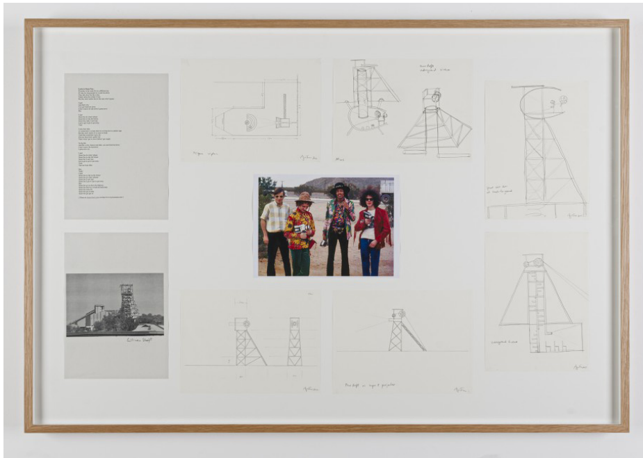
Figura 8. Stone Free: Research Composite 1 , 2012, desenhos, fotocópias e fotografia, 91,5x64,7 cm.

Como se pode ler no folheto da exposição Political Cameras , realizada em 2013 na Stills , Escócia, a exposição simultânea da obra final e da documentação da investigação que lhe deu origem permite ao espectador criar as suas próprias leituras da obra, ao mesmo tempo que o leva também a perceber todo o processo que levou à sua criação (Figs. 9 e 10):