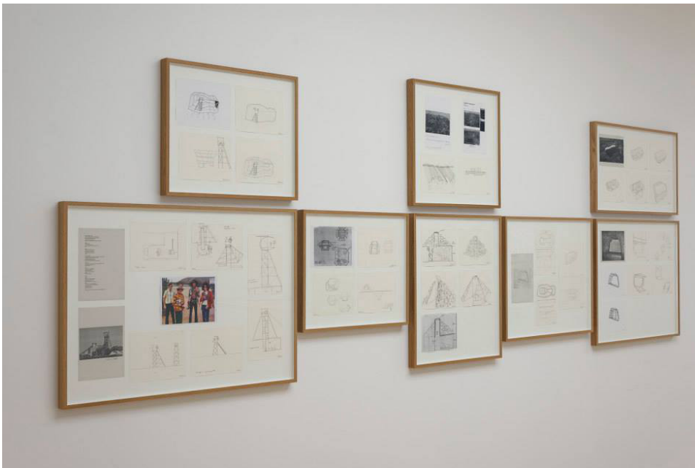
Figura 10. Pormenor da exposição Stone Free (vista dos Composite Drawings ) de Ângela Ferreira na Marlborough Contemporary, Londres, 2012.