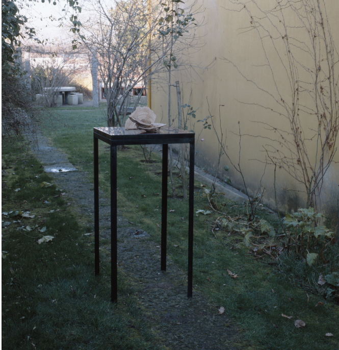
Figura 4. Paisagem íntima 1, 2004, madeira de castanho, granito preto polido e ferro pintado de preto, Coleção Alberto Carneiro, Imagem publicada nos catálogos das exposições Alberto Carneiro, Caminhos do corpo sobre a terra 1965-2004 (Centro Cultural de Cascais, 2005); Alberto Carneiro. Paisagens Íntimas (Casa Municipal da Cultura, Cantanhede, 2006) e Os murmúrios da floresta e do meu jardim 1991-2005 (Galeria Trinta, Santiago de Compostela, 2006)

Retomando a dialética esconder/ mostrar , referida atrás, facilmente percebemos que estas imagens escondem claramente qualquer vestígio do “fazer”, do trabalho efetivo do escultor sobre a matéria. As esculturas não são fotografadas no interior do ateliê onde foram produzidas (e junto às quais se poderiam eventualmente vislumbrar vestígios do trabalho manual, como instrumentos de escultura, resíduos da madeira, etc.), mas são antes mostradas no lugar onde o escultor as terá primeiramente concebido, na medida em que trabalha com a natureza e com os elementos naturais que sempre o rodearam. É importante aqui o exemplo de Brancusi, um dos primeiros artistas a tomar consciência da importância do lugar de criação para a correta exposição e apresentação da obra de arte. Para si o ateliê era o único lugar onde a sua obra era verdadeira, e por isso apenas aí deveria ser vista. Mais do que mostrar o artista no ato criativo ou de produção, as inúmeras fotografias tiradas por Brancusi e por colegas e amigos no seu ateliê mostram as esculturas dispostas segundo