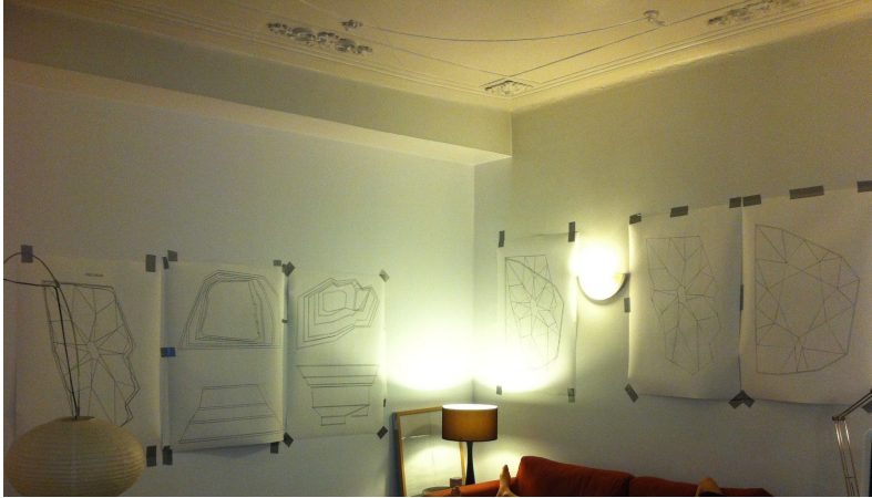
Figura 6. Vista da sala de estar de Ângela Ferreira, com desenhos da investigação para a obra Stone Free (2012).

Ao colocar a documentação com que trabalha nas paredes da cozinha, Ângela Ferreira não só otimiza o seu espaço de trabalho, como garante para si um acesso constante à investigação que irá levar à produção do objeto final: