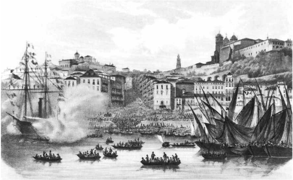
Figura 2 – “Imbarco della Real Salma”, de Enrico Gonin (1851); ideia de modernidade manifestada na amplitude e regularidade, aqui exageradas, da Rua de São João

A nova linguagem estilística, já presente nas novas concepções urbanas, implantou-se a partir da arrojada opção do Governador em renunciar ao estilo então em voga, o tardo-barroco 54 , e abraçar o palladianismo inglês, que passou a figurar nas principais construções civis. Para contextualizar melhor este aspeto deveremos lembrar que era o “barroco aparatoso que agradava aos sentidos de toda a clientela” 55 .