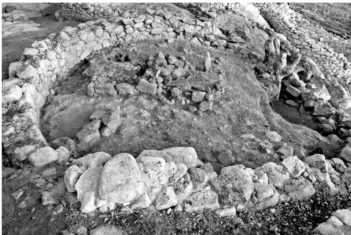
Fig. 2 - Estructuras (VII e XVIII) alineadas co muro que pecha a croa do monte. Detalle da estrutura VII.