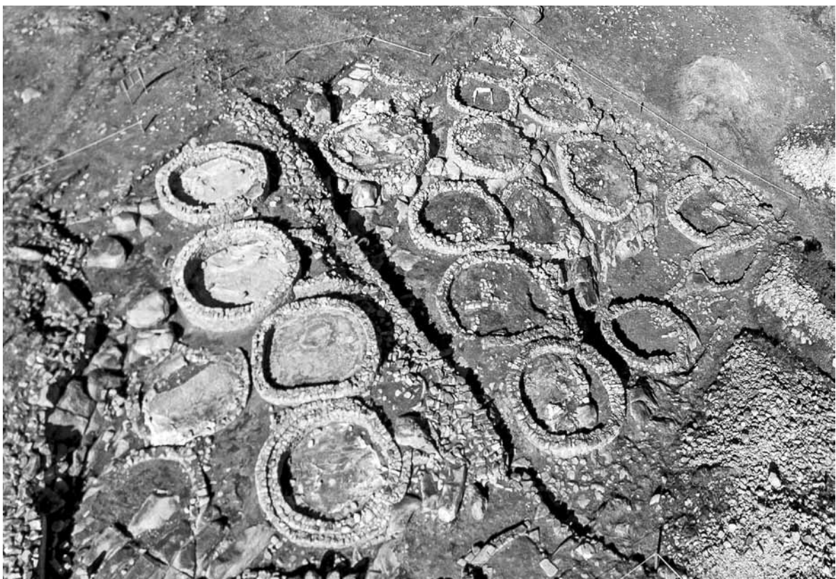
Fig. 1 – Monte do Facho. Vista aerea xeral e área escavada no 2008.