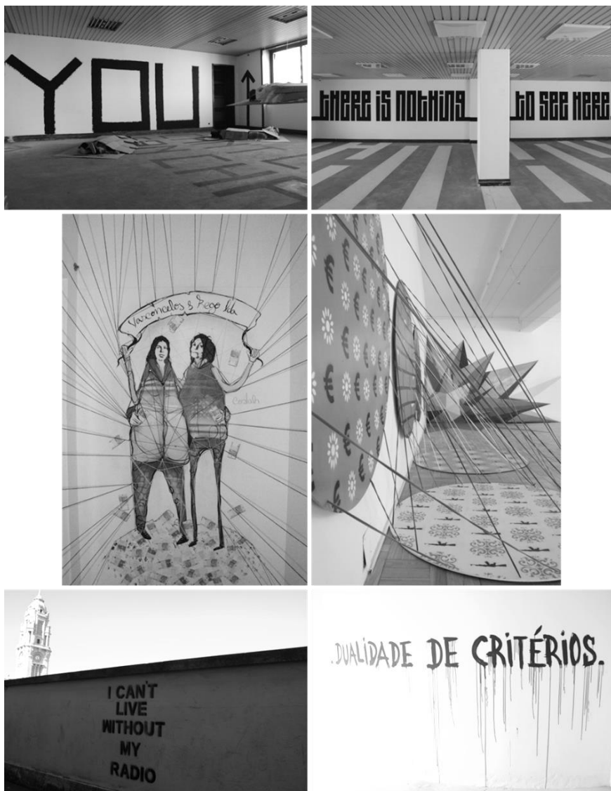
Figura 3: Street Art Axa Porto, Porto, 2014.

final de 2015, a seguradora colocou o edifício à venda, fazendo com que as actividades culturais deixassem o edifício antes do previsto. Porém, a vontade da autarquia é que as actividades que ali decorriam continuem num ou em mais espaços diferentes, equacionando a possibilidade de replicar esta experiência num outro edifício devoluto da cidade. Tal vem assim confirmar a sensibilidade das políticas urbanas em relação à cultura e ao seu potencial de transformação do espaço urbano e de revitalização e valorização económica e social da cidade.