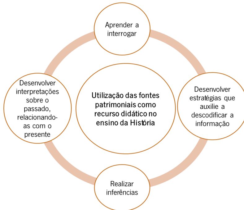
Figura 2: Uso de Fontes Patrimoniais no Ensino da História.

Em contrapartida, esta realidade tem motivado vários investigadores a desenvolverem estudos no âmbito da Educação Histórica com a principal finalidade de revelar as ínfimas potencialidades que a exploração das fontes patrimoniais no ensino da história, em contexto educativo, pode contribuir para o desenvolvimento do pensamento histórico em crianças e jovens.