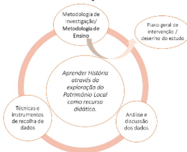
Figura 3: Desenho metodológico do estudo desenvolvido.