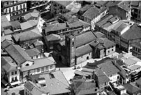
Figura 5 – A Igreja Matriz.

A pesquisa documental mostra ainda que a Igreja Matriz 35 (figura 5) também sofreu várias intervenções na segunda metade do século XVIII, quer de preservação, quer de obras que foram executadas de raiz, sobretudo no interior do templo: “Nesta mandaram e requereram a sua Magestade que Deos guarde fosse cervido conseder provisam para se tirar do deposito dos bens de rais algum dinheiro para veneração da igreja matris desta villa por a camara não ter renda para mandar venerar preditamente nesenario nella como be consertar os orgaos por vidrassas nas ginellas do coro por dentro e por fora pintar o forro mulduras dos orgaos e pulpitos o que be tam preciso como para veneralo do tamposto (?) de Deos nosso Senbor.” 36 Apesar de se tratar de um edifício religioso, a responsabilidade da manutenção da Igreja Matriz de Ponte de Lima pertencia à Câmara Municipal desde o século XVII: “Num documento emanado do Arcebispado de Braga, datado de 1673, ficaram exactamente definidos os deveres que a Câmara passava a ter com a Matriz de Ponte de Lima” . 37