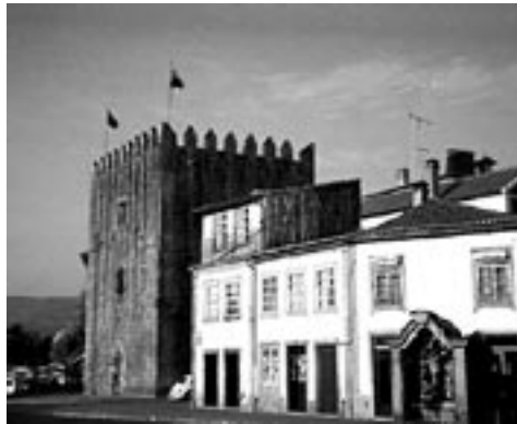
Figura 4 – A Torre da Cadeia.

Outro edifício que foi alvo da constante preocupação camarária no século XVIII foi a Torre da Cadeia 32 (figura 4).