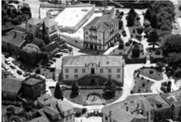
Figura 6 – Paços do Concelho.

Contudo, a grande obra da segunda metade do século XVIII foi sem dúvida a ampliação dos Paços do Concelho (figura 6).