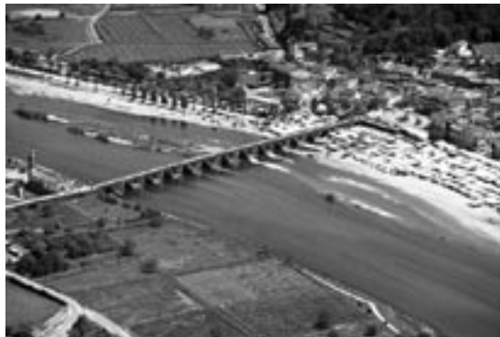
Figura 3 – A ponte de Ponte de Lima.

A câmara patrocinava as obras públicas que estavam directamente ligadas com o interesse colectivo da população da vila e das restantes freguesias do concelho 26 . Contudo, a documentação prova que as preocupações urbanísticas e patrimoniais na vila eram mais exigentes. Questões como a segurança, a acessibilidade, a administração, a justiça e a manutenção da ordem eram prioritárias e estão na base da encomendada arquitectónica camarária 27 . Nas restantes freguesias as obras visavam sobretudo as acessibilidades e o abastecimento de água, à excepção da freguesia de Arcozelo, que compartilha as margens do rio Lima com o núcleo urbano, e que sempre estabeleceu uma forte ligação com a vila 28 . A ponte 29 foi desde sempre alvo de grande atenção, não só porque facilitava o contacto entre as duas margens, mas também porque por ali passava uma importante via que ligava Braga a Tui. A ponte (figura 3) foi “ o qualificativo de uma comunidade que com ela e por ela nasceu ” 30 , tanto mais que a primeira freguesia de Ponte de Lima se chamava precisamente Santa Maria da Ponte.