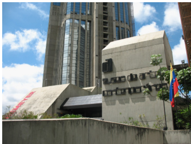
Foto 6 Fachada del Museo de Arte Contemporáneo de Caracas, 2009.