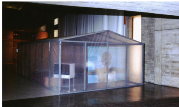
Foto 2 Mailén García Proyecto Crónicas, 1997 Museo de Bellas Artes, Caracas (vista externa)