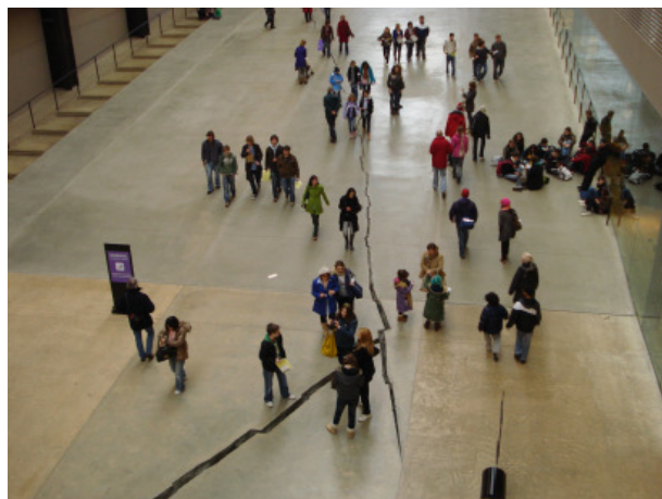
Foto 4 Vista de la obra Grieta de Doris Salcedo Tate Gallery, 2008