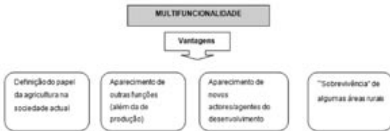
FIGURA 2 – VANTAGENS DA MULTIFUNCIONALIDADE (SEGUNDO PINTO-CORREIA, 2006, p.8)

Num estudo realizado pela Universidade de Évora em 2006, sob a coordenação de Teresa Pinto-Correia, sobre o abandono em Portugal Continental, são aludidas algumas vantagens em se considerar a multifuncionalidade como um atributo do espaço ou do território rural, para além da agricultura, mas incluindo-a (figura 2):