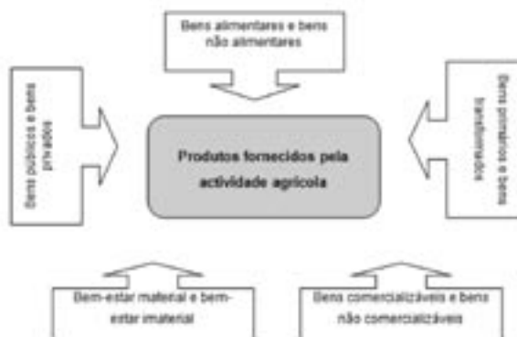
FIGURA 3 – PRODUTOS FORNECIDOS PELA ACTIVIDADE AGRÍCOLA

Os bens públicos produzidos pela multifuncionalidade da actividade agrícola resultam da acção de políticas implementadas por agentes económicos privados. Desta forma, as paisagens rurais são o resultado da acção de agentes económicos privados, numa estrutura produtiva privada, mas são um bem público, em virtude de todos beneficiarem dela não só no presente, como também no futuro. Uma parte dos bens produzidos são bens não comercializáveis, como é exemplo o bem-estar.