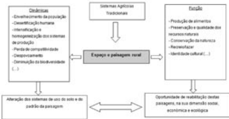
FIGURA 1 – DINÂMICAS E FUNÇÕES DO ESPAÇO E PAISAGEM RURAL

Actualmente, as áreas rurais e, conseqüentemente, as paisagens rurais encontram-se num cruzamento de importantes mudanças (figura 1).