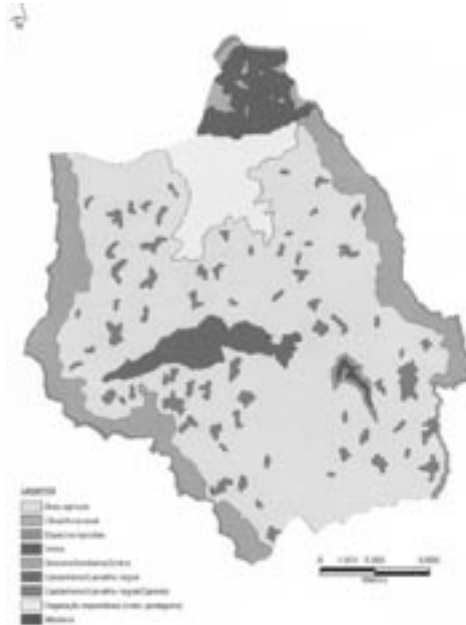
FIGURA 5 – PROPOSTA DE ORDENAMENTO DO TERRITÓRIO PARA O CONCELHO DE FIG. CAST. RODRIGO

O carvalho e o castanheiro são, também, utilizados na rearborização da Serra da Marofa. O carvalho é o representante mais importante, a nível arbóreo, da flora autóctone desta zona. A madeira destas duas folhosas pode ser utilizada na construção civil, na carpintaria e mobiliário, funcionando, deste modo, como uma fonte de matéria-prima. O castanheiro fornece, ainda, a castanha, fruto procurado nos mercados nacional e internacional.