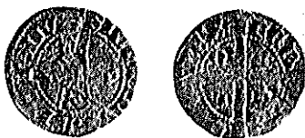
Reprodução fotográfica da moeda acima desenhada com a indicação de fig. 7.