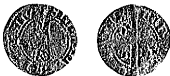
Quarto de barbuda módulo = 19 mm peso = 0,82 gramas