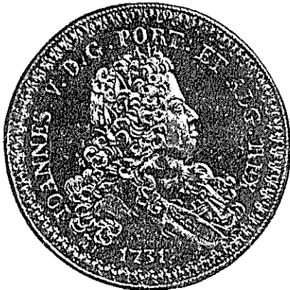
D. JOÃO V