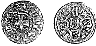
D AFONSO IV