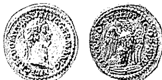
DOMICIANO. Tipo Coh. 359