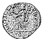
VESPASIANO Coh. Falta (91-A) MATT. e SYD. 10