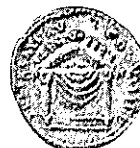
TITO Coh. 311,v