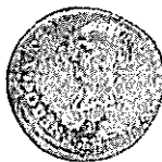
NERO e CLÁUDIO Coh. 5