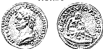
DOMICIANO Tipo Coh. 159