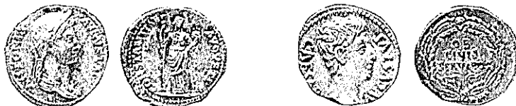
ANTÓNIA Coh. 2