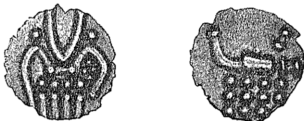
Exemplar « A »