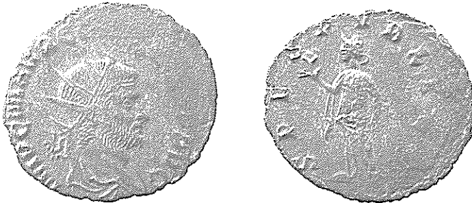
Figura 1 (x 2)

Passando à moeda que é objecto deste breve apontamento, a sua leitura e descrição não parecem levantar obstáculos de maior. O único aspecto digno de nota reside no facto de a peça apresentar esmagadas parte da legenda do anverso e o final da do reverso devido a um pequeno acidente de cunhagem. É muito provável que uma ligeira deslocação do flan entre dois golpes de martelo tivesse levado a que, numa zona já cunhada, a legenda fosse esmagada pelo bordo do cunho 11 . Refira-se ainda a presença de vestígios de película de prata aderente na moeda. O seu peso, 2,42 gramas, é inferior ao peso médio dos exemplares atribuídos à emissão I: 2,93 gramas.