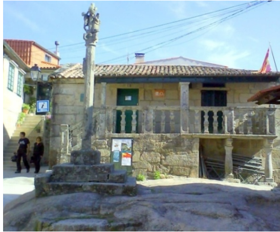
Ilustración 8 Biblioteca de Combarro (Foto: A. Mesía, agosto 2008)