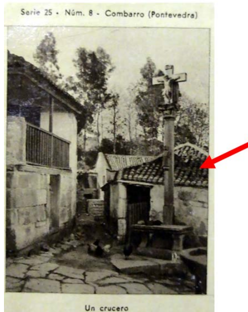
Ilustración 2 Casa terrera

La tipología evolucionó en otra más ventilada, con una ventana adicional, en el ángulo superior de la puerta, como podemos ver en la Ilustración 3 en otra fotografía de Ksado 22 .