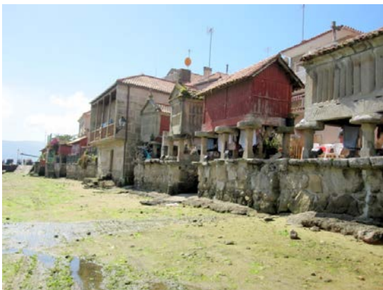
Ilustración 11 Hórreo de Combarro (Foto: A. Mesía, septiembre 2010)

Su disposición a la misma orilla del mar, en lo que constituye la mayor agrupación de hórreos de Galicia 27 , y su conexión con las viviendas y espacios públicos, es lo que da a Combarro su peculiar imagen.