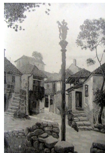
Ilustración 7 Casa con patín cubierto en el último tramo. Manuel Abelenda. Puesta de sol en Combarro . Ca.1940

Si nos detenemos en la Plaza de San Roque, la postal por excelencia de Combarro, vemos una casa cuyo patín, se convierte en “solaina”, si atendemos a su longitud. Es la vivienda más vistosa de Combarro, data del siglo XVIII y, actualmente, alberga una biblioteca (Ilustración 8). Lo que más nos llama la atención es su magnífica balaustrada de granito. En su fachada lateral, además, dispone de una solaina que, como un balcón, sostenido por ménsulas, mira al mar (Ilustración 9).