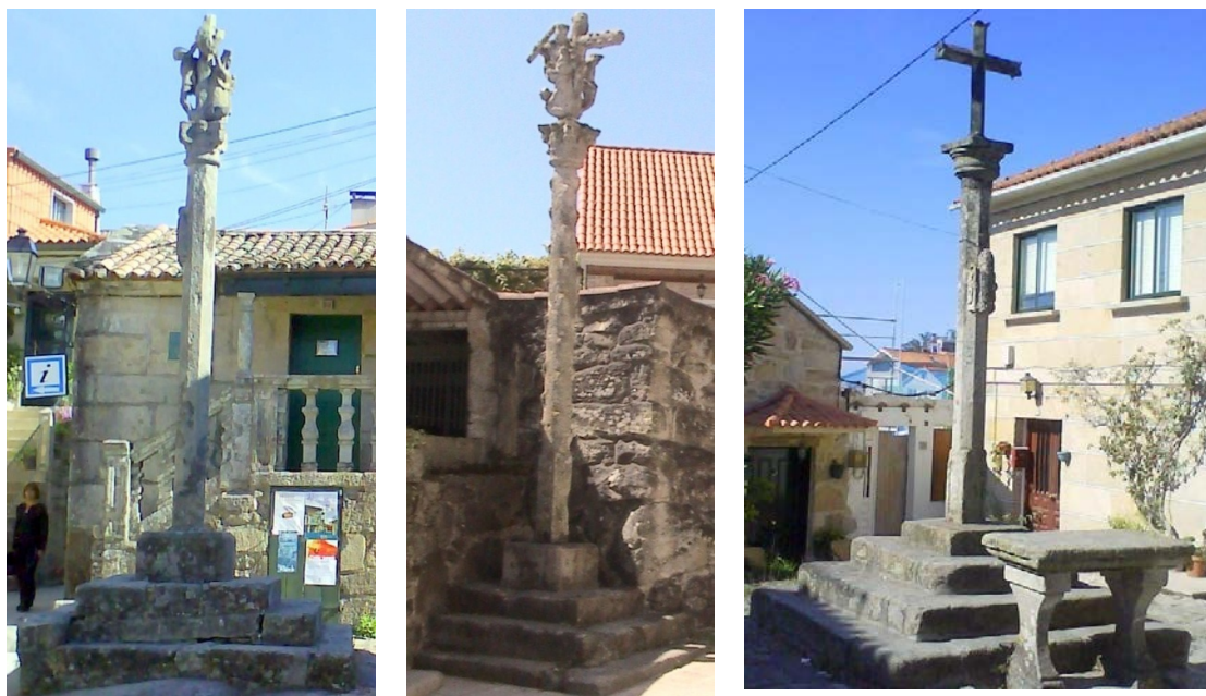
Ilustración 14 Cruceiros de Combarro (agosto 2008)