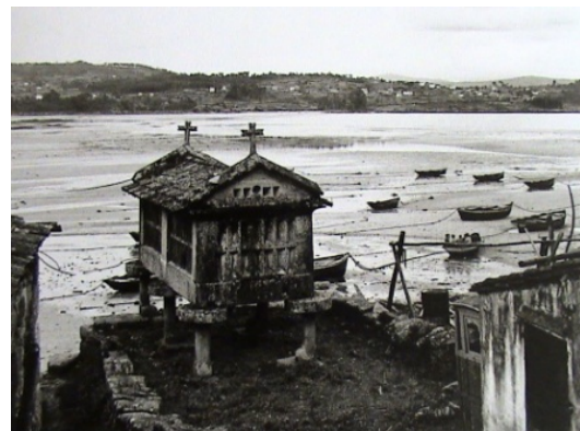
Ilustración 12 Hórreo de Combarro (Foto: Jean Dieuzaide, 1961)

Su originalidad ha hecho a Combarro objeto de pintores y fotógrafos que, desde los inicios del siglo XX, llegaron al pueblo para inmortalizar su pintoresquismo. Las fotografías, óleos, acuarelas y dibujos resultan ahora de gran valor para estudiar la evolución de la arquitectura, su grado de conservación y los contrastes con las nuevas construcciones.