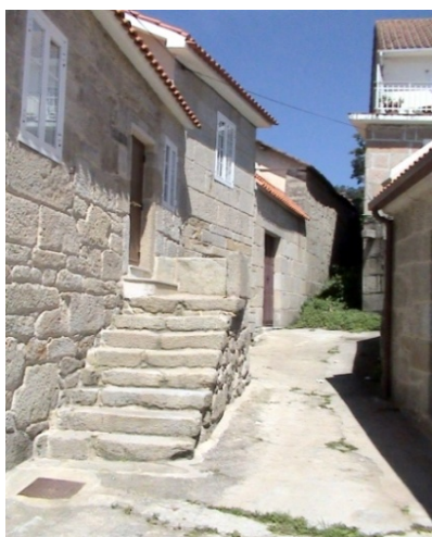
Ilustración 5 Casa con patín paralelo a la fachada y adosado a ella (Foto: A. Mesía, agosto 2008)

En Combarro vemos muchas casas con esta solución arquitectónica, que puede adoptar diversas formas: paralelo a la fachada y adosado a ella (Ilustración 5) o de frente a la vivienda (Ilustración 6); en ocasiones, el tramo final se cubre para aumentar el tamaño de la vivienda (Ilustración 7). En la mayoría de los casos, el patín no lleva barandilla.