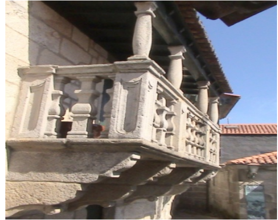
Ilustración 9 Solaina lateral de la Biblioteca de Combarro (Foto: A. Mesía, agosto 2008)

A pesar del interés que conservar las tipologías de viviendas marineras, para el turismo, el atractivo principal de Combarro para el turismo, son los hórreos. En la actualidad sobreviven alrededor de 30 aunque en el pasado fueron muchos más, según un artículo de Avelino Rodríguez Elías, fechado en 1917 donde hace alusión a los hórreos de Combarro indicando el número de doscientos o trescientos: “Que fue y es rica, lo dicen sus hórreos, de piedra de granito la inmensa mayoría de ellos. Y como si sus doscientos o trescientos hórreos no fueran bastantes a contener todo el maíz ...” 26 .