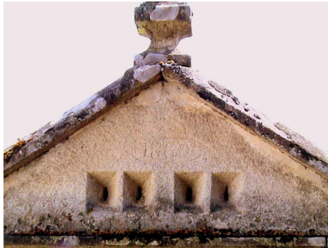
Ilustración 13 Hórreo con la fecha de construcción grabada: 1860

Otro de los grandes atractivos de Combarro son los cruceiros. Dentro del conjunto histórico hay siete.