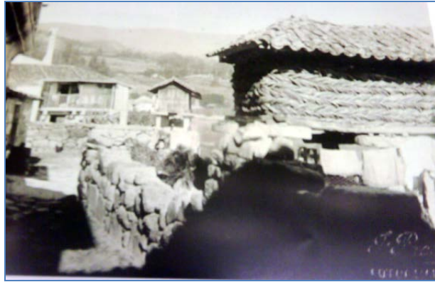
Ilustración 10 Palleira (Foto: Jaime G. Pacheco, 1925 ?)

Su disposición a la misma orilla del mar, en lo que constituye la mayor agrupación de hórreos de Galicia 27 , y su conexión con las viviendas y espacios públicos, es lo que da a Combarro su peculiar imagen.