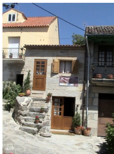
Ilustración 6 Casa con patín frontal (Foto A. Mesía, agosto 2008)