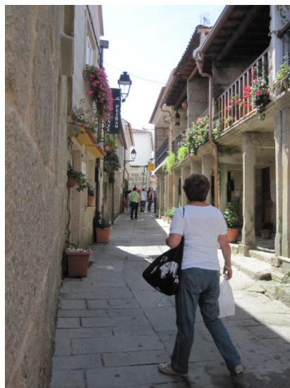
Ilustración 1 Calle principal (Foto: A, Mesía. Septiembre 2010)

Las viviendas todavía conservan las tipologías arquitectónicas tradicionales. En la calle principal (Ilustración 1) observamos casas de dos plantas con galerías, tejados a dos aguas y soportales.