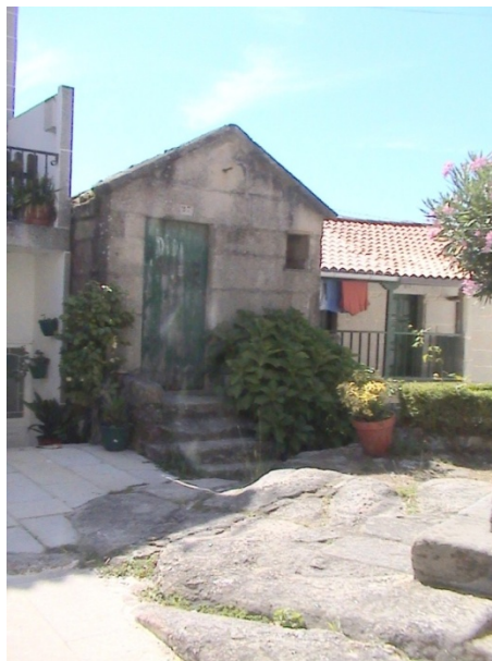
Ilustración 4 Casa de pincho (Foto: A. Mesía, agosto 2008)

Una de las tipologías de viviendas marineras más interesantes es la “casa con patín”. Un patín es una escalera que sube directamente al primer piso, generalmente su razón de ser es la de salvar un desnivel del terreno; este patín se puede convertir en “solaina”, si el tramo final es largo (más de tres metros, según Martínez Sarandeses 23 ), en este caso, la vivienda dispone de un espacio adicional exterior que se puede utilizar para secar ropa, espigas, trabajar o