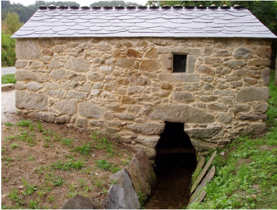
Figura 2. Recuperación de patrimonio etnográfico: Muíños

de todo tipo pola notable compartimentación do relevo, sucedéndose as fervezas e os vales encaixados por tódolos recunchos da rexión.