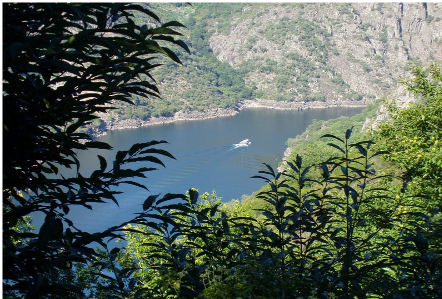
Figura 3. Turismo escénico: catamaráns do Sil e do Miño

O sistema fluvial Miño-Sil, o máis importante de Galicia por lonxitude e caudal, discorre en moitos tramos fortemente encaixado, entre canóns de espectacular beleza. Ó longo dos séculos estas terras afastadas, de difícil acceso e condicións de vida duras foron escollidas por ordes relixiosas para fundar mosteiros e erixir igrexas e ermidas, sobre todo durante a Idade Media. Como consecuencia, nestas comarcas existen algunhas das mellores representacións da arte Románica de Galicia. Ó mesmo tempo, as especiais condicións climáticas, mais secas e calorosas que a entorna, foron aproveitadas para o cultivo da vide, actividade que tivo que vencer as fortes pendentes aplicando laboriosas e enxeñosas técnicas baseadas no cultivo en terrazas (aquí chamadas “sualcos”). A vida monástica e o cultivo secular do viño conformaron unha paisaxe cultural de incalculable valor que recibe o certo nome de Ribeira Sacra , un dos territorios con máis personalidade de Galicia.