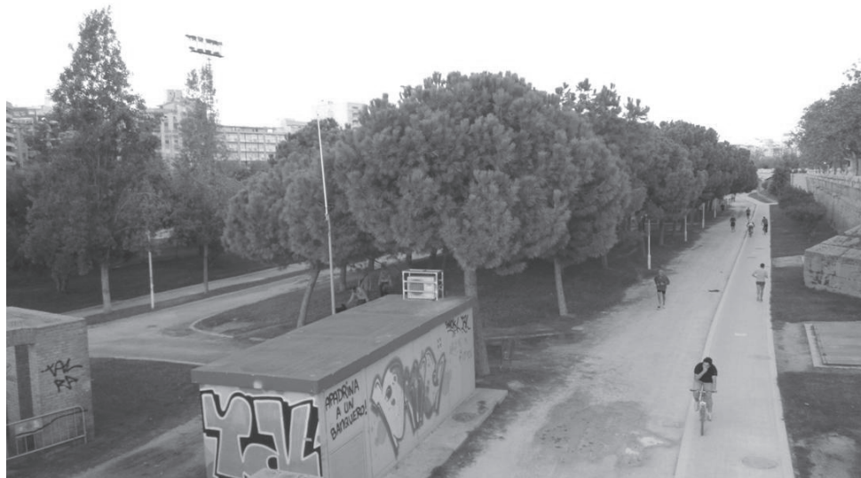
Fig. 3 – Valência