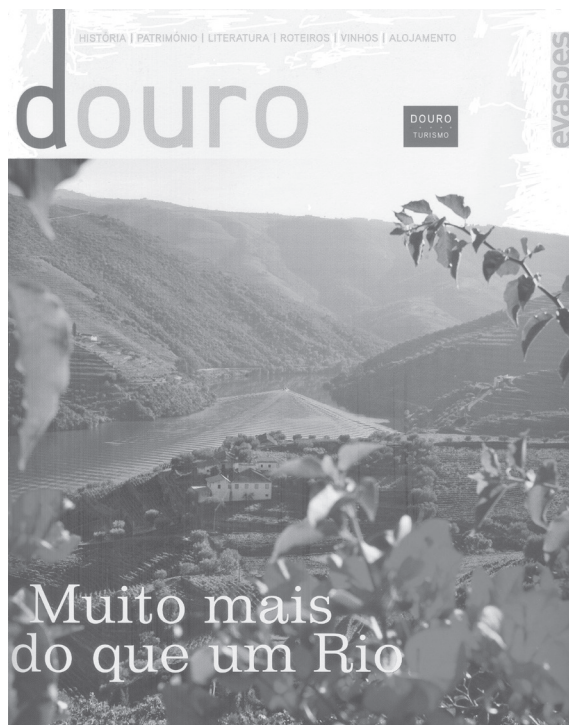
Fig. 1 – Promoção do Douro