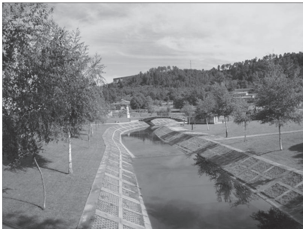
Fig. 4 – Boticas