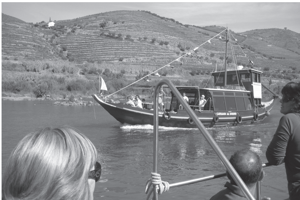
Fig. 2 – Passeio no Douro