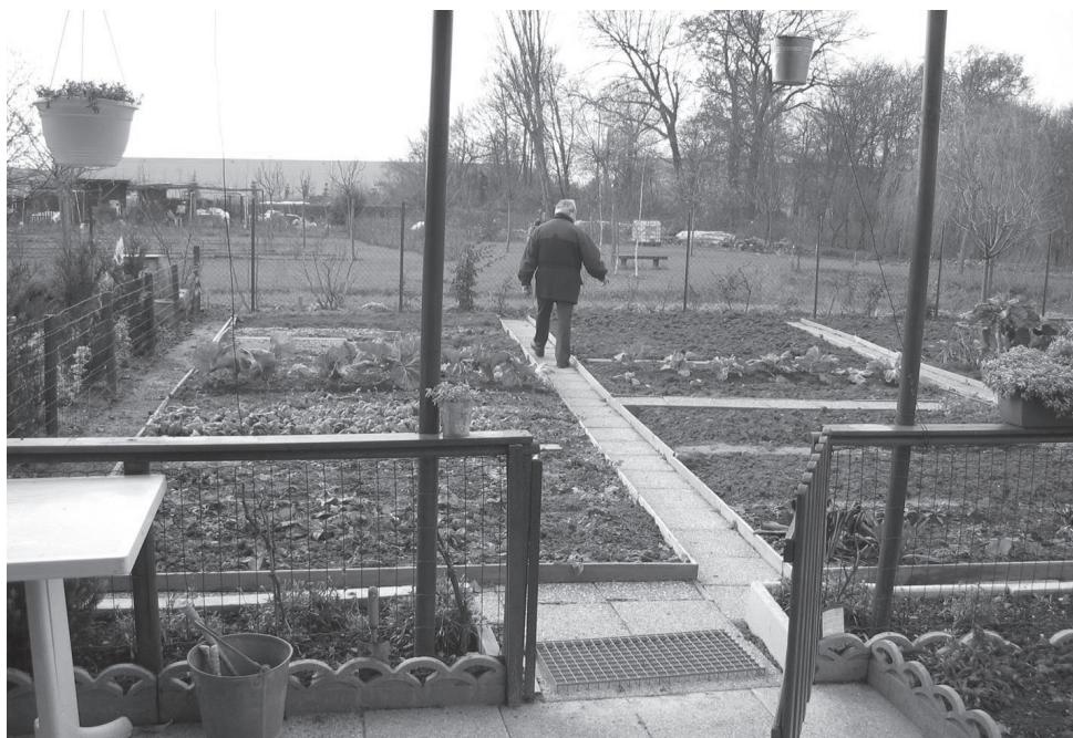
Fig. 6 – Hortas comunitárias em Ris-Orangis