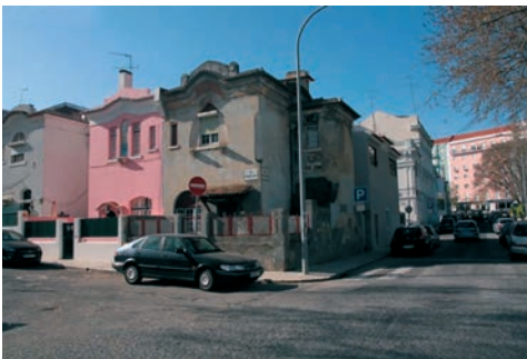
Figura 8 – Bandas geminadas de habitações unifamiliares de 2 pisos