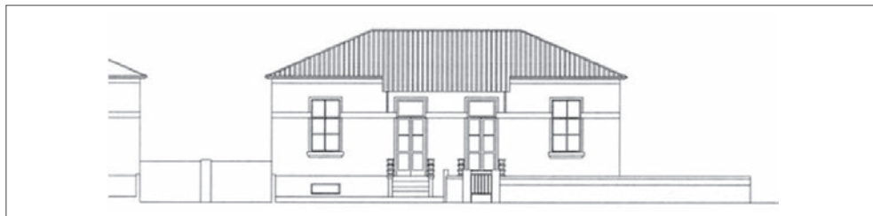
Figura 1 – Alçado Principal