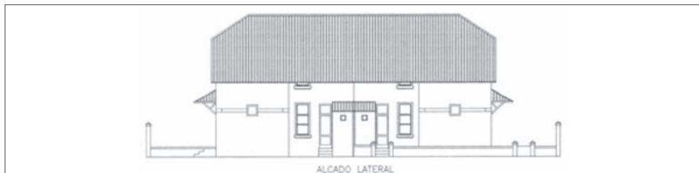
Figura 4 – Alçado Lateral

Fonte: Arquivo Histórico da Câmara Municipal do Porto