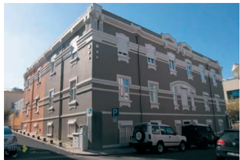
Figura 9 – Edifícios quadrangulares de 3 pisos