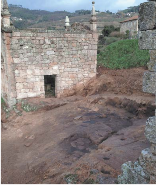
Figuras 6 e 7. Ruínas da Casa de Covela. Trabalhos de limpeza.