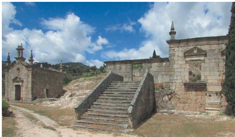
Figura 5. Ruína da Casa de Covela. Vista geral.