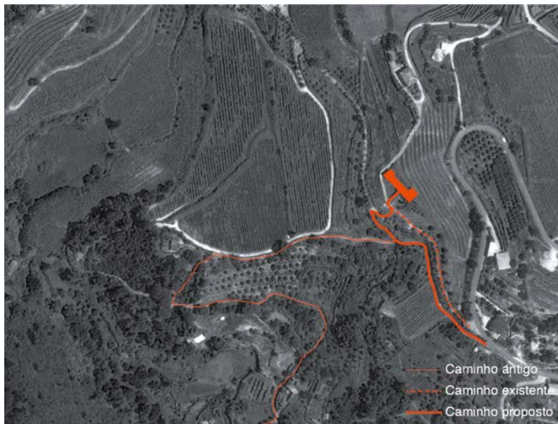
Figura 11. Reabilitação da Casa de Covela. Novo acesso.