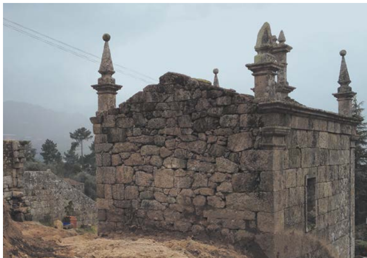
Figura 4. Ruína da Casa de Covela. Fachadas tardoz e lateral Noroeste.