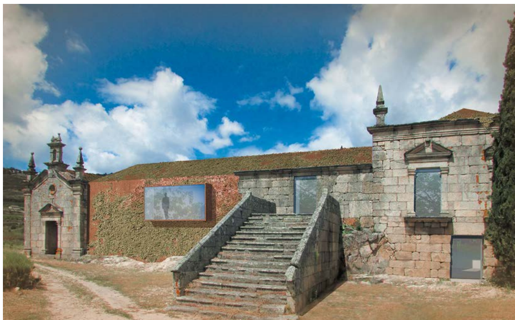
Figura 12. Reabilitação da Casa de Covela. Simulação tridimensional.