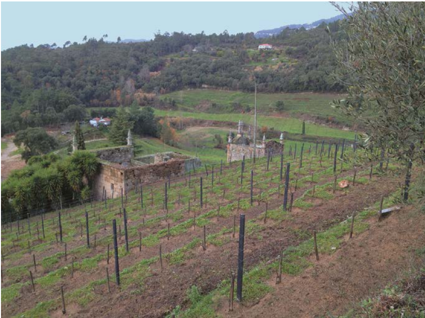
Figura 3. Ruína da Casa de Covela. Fachadas tardoz e lateral Sudeste.

A Casa parece ter sido o resultado da conjugação de construções várias, dado o seu carácter fragmentado e a diversidade de elementos arquitectónicos, como atestam: a este-rotomia dos paramentos exteriores, que varia muito das fachadas frontais para as laterais e traseira, bem como os alicerces e sectores inferiores dos referidos paramentos, onde se percebe a vontade de aproveitar as pedras de maior dimensão para zonas mais visíveis; a falta de travamento entre as paredes, quer exteriores, quer interiores; a composição do conjunto, muito dispersa e a escala dos diversos elementos constituintes; os elementos decorativos existentes; e, finalmente, a dificuldade em encontrar uma solução una e verosímil para a sua reconstituição volumétrica. O corpo central do conjunto, construído sobre o maciço rochoso, que poderia ter correspondido à fase inicial da edificação, não tem escala que justifique a enorme escadaria central de acesso à porta principal, de dimensões bastante reduzidas; escala contrariada no corpo sudeste, implantado muito próximo do referido eixo de acesso, já com dois pisos. De igual modo é enigmática a interpretação para o vazio existente entre estes dois volumes e a capela (fig. 5).