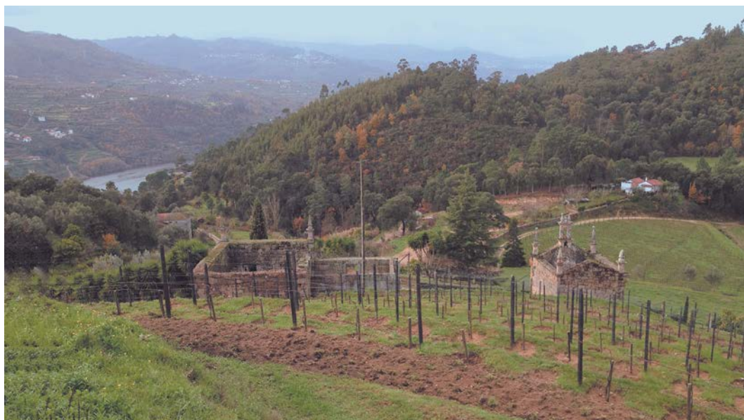
Figura 2. Ruína da Casa de Covela. Fachada tardoz.

A antiga Casa de Covela implantou-se na face nordeste do anfiteatro natural que definiu a propriedade, voltada para o rio Douro, como resposta a uma clara intenção cenográfica, dado o forte enquadramento visual a partir do mesmo, do qual se acedia, por meio de um caminho sinuoso.