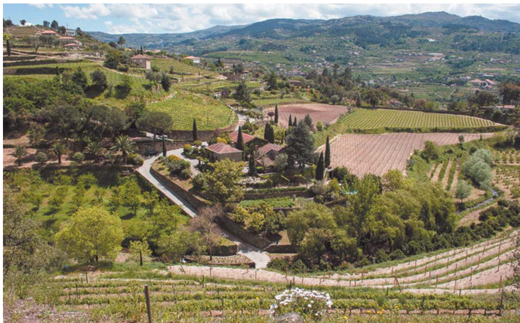
Figura 1. Quinta de Covela. Vista geral.