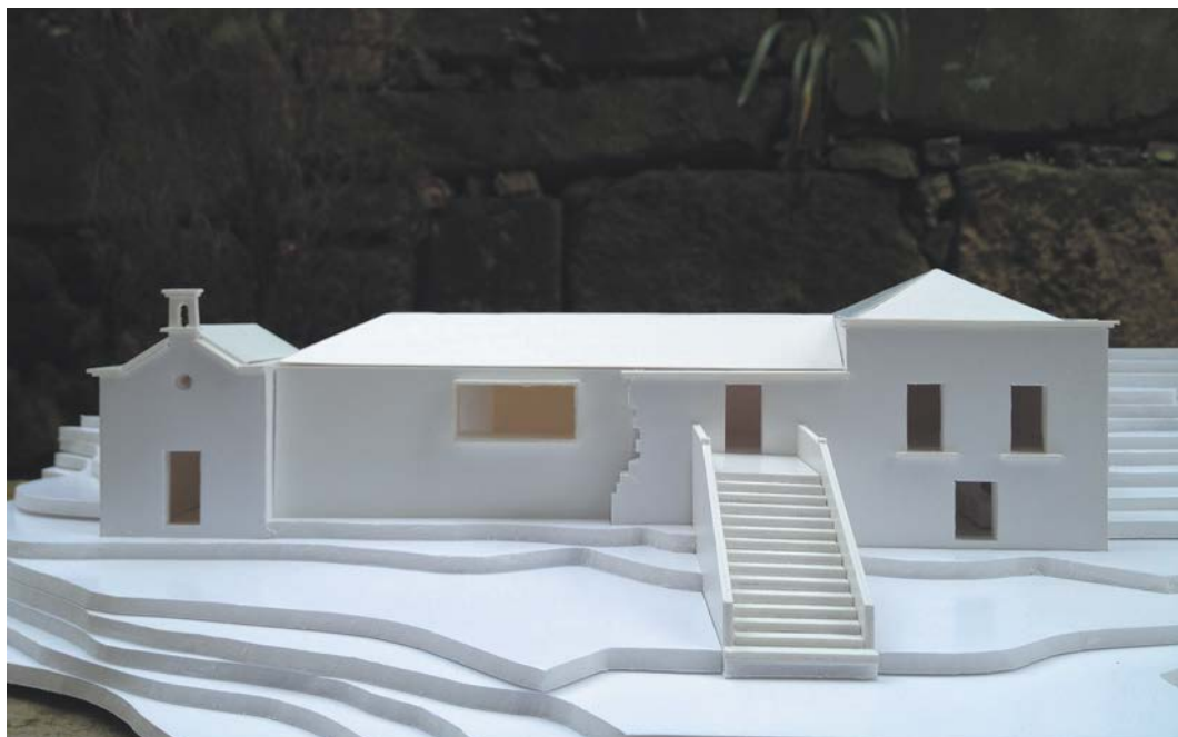
Figura 8. Reabilitação da Casa de Covela. Maqueta.

Perante a intenção de não completar o edifício, quer por falta de elementos, quer mesmo por fortíssimas dúvidas de que alguma vez, pelo menos neste local, o mesmo tenha sido completado; assim como pela vontade de manter o seu valor e beleza, enquanto ruína, optou-se por uma linguagem arquitectónica contemporânea, com coberturas inclinadas, para estabelecer uma relação volumétrica harmónica com a preexistência, que resolve o problema da ambiguidade na interpretação do monumento, comprovadamente resultado de uma oscilação entre a resposta às questões funcionais e a uma intenção cenográfica. Assim, todos os planos volumétricos novos, construídos à face dos planos interiores do que teriam sido as paredes e coberturas do edifício desaparecido, com aparência metálica oxidada, contribuirão para a unificação volumétrica e cromática do conjunto edificado, hoje desarticulado. É excepção a este princípio o corpo dos sanitários, construído fora deste sistema unitário, em volume de betão à vista e cobertura plana, integrado na topografia do terreno envolvente.