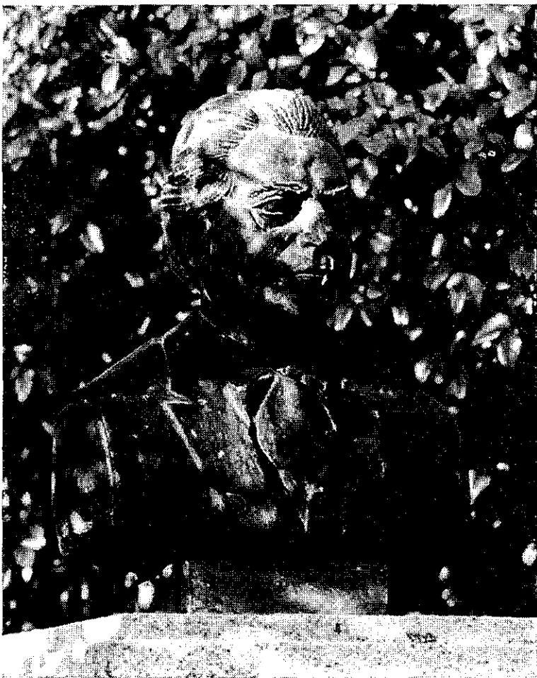
Busto de Leonardo Coimbra, existente na Praça de Pedro Nunes

Fotografia de António Carvalho (Valente) — 1989