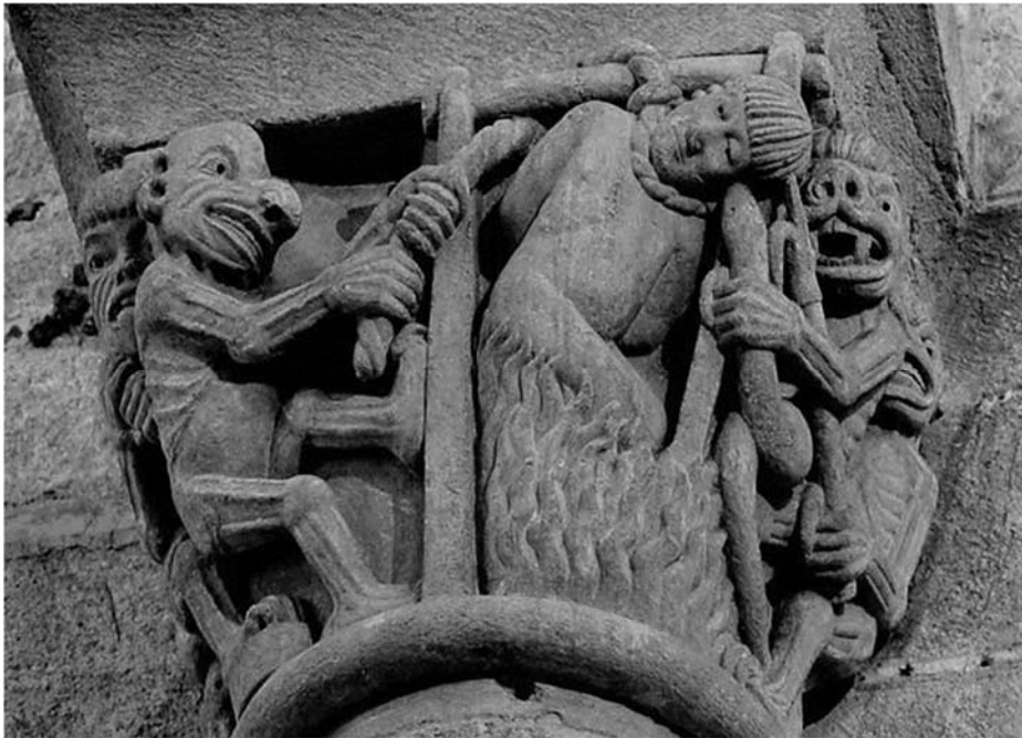
Imagen 1. Ilustración con la supuesta condena del avaro (al cual le falta la característica bolsa sobre el cuello) ahorcado en el capitel contiguo a la capilla de la Santa Cruz, crucero de la Catedral de Santiago de Compostela, alrededor del 1102.