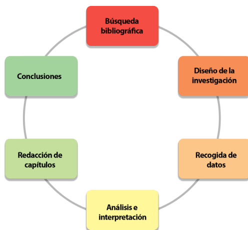
Fig. 1. Proceso de investigación circular

Así, la escasez de fuentes escritas y audiovisuales desde primera hora nos llevó a la aplicación de un proceso de investigación circular en las fases de investigación (véase Fig. 1) siguiendo un enfoque más cualitativo, alejado del proceso investigativo lineal propio del método histórico tradicional utilizado habitualmente en la disciplina de la Historia de la Educación. Este enfoque cíclico nos ayudó a avanzar de forma progresiva, sistemática y profunda sobre los datos repetidas veces, garantizando la validez, fiabilidad y reflexividad del estudio 13 .