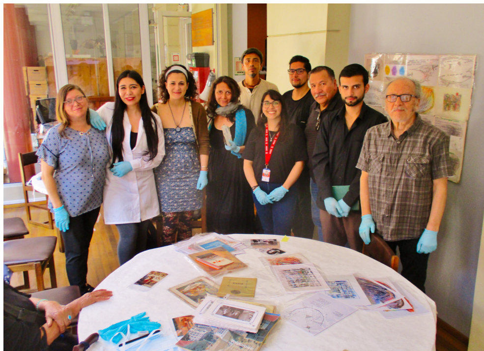
Fig. 14. Mediación de «archivo expuesto» hacia la ciudadanía con documentos originales de Osvaldo Rodríguez y apoyo de instrumentos pedagógicos de Archivo Nómada en Museo de Historia Natural, Valparaíso, Chile

bajo desde 2016 para la conservación documental y registro en base al principio de procedencia y de orden original. A lo largo del desarrollo de esta investigación se trabajó con documentos del archivo personal de Osvaldo Rodríguez Musso, cuyo marco temporal contempla manuscritos fechados entre 1973 hasta 1996, año en que fallece en la ciudad de Bardolino, Italia a los 53 años. Su archivo personal está compuesto por una amplitud de formatos, en los que se encuentran cuadernos, cartas, fotografías, tarjetas postales, dibujos, pinturas, discos, casetes, carpetas, máquina de escribir, objetos de colección y accesorios de vestuario.