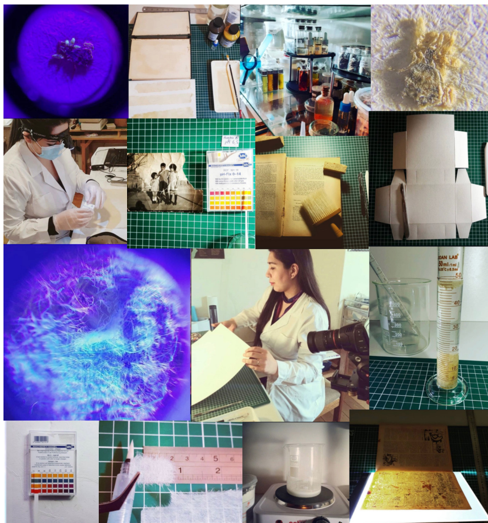
Fig. 6. Procedimientos de conservación y restauración documental en el laboratorio de «Archivo Nómada»

Lo anterior ha sido posible gracias a la adquisición de diversos insumos específicos, como lupas, microscopios, escáneres, tiras reactivas de medición de pH, luxómetro, higrómetro, entre otros elementos. El uso constante de este tipo de implementos ha sido fundamental para adquirir cierta experiencia y lograr prestar asistencia a otras unidades de información, comprobando mediante visitas in situ la existencia de actividad fúngica o bibliófaga en sus depósitos de colecciones, analizando el estado general de sus mobiliarios, y constatando si existen indicios de acidez y/o foxing en sus acervos, entre otros daños. Se ha podido elaborar distintos tipos de pegamentos libres de ácido en base a