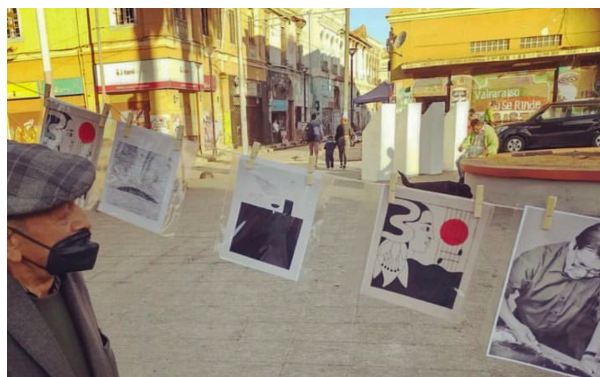
Fig. 10. Actividad de Museo Itinerante en Plaza Echaurren, Valparaíso, Chile

En otro ámbito, se han podido desarrollar diversas instancias de mediación en la FSCH, donde se ha proporcionado a la población infantil y adulta diversas reproducciones de los grabados de Santos Chávez a modo de museo itinerante, los cuales han podido ser observados y palpados en espacios educativos y en la vía pública, a simple vista y también a través de microscopios portátiles, que les han permitido a los usuarios estudiar la estampa y el trazo del grabado desde su origen de la matriz de madera, entendiendo las diferencias técnicas que hay entre el grabado, el dibujo y la pintura.