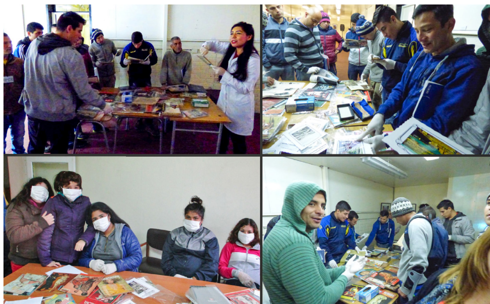
Fig. 3. Intervenciones documentales con niños bajo la tutela de SENAME y adultos privados de libertad de la Cárcel de Valparaíso

Para poder registrar y comprobar si existe un verdadero interés de parte de la ciudadanía hacia un acceso documental que involucre factores históricos y culturales, «Archivo Nómada» suele aplicar instrumentos de consulta e investigación en lugares donde es limitado o imposible el acceso documental. En este sentido se han realizado talleres en espacios como la Cárcel de Valparaíso, con reos de edad adulta, así como también con niños y niñas internados en el Servicio Nacional de Menores (SENAME), obteniendo gran convocatoria con resultados altamente favorables.