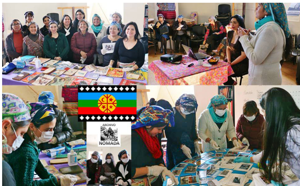
Fig. 4. Taller documental con mujeres mapuche, Santiago, Chile

Por su parte, el encuentro presencial y constante diálogo por medios digitales con bibliotecólogos, archiveros, conservadores/restauradores y museólogos a nivel internacional, ha sido un hallazgo para «Archivo Nómada», ya que se ha logrado conformar una red de trabajo colaborativo con profesionales de Santa Fe y Buenos Aires (Argentina), Montevideo (Uruguay), San José (Costa Rica), Laguna y Florianópolis (Brasil) y Ciudad de México y Sinaloa (México), lo cual ha enriquecido la visión del proyecto, aportando información relevante en torno a las principales diferencias culturales y puntos de encuentro de historia común entre distintos países de centro y Sudamérica. Para Halbwachs 1 (1968), toda memoria se sustenta en identidades de grupo, sin embargo es preciso inicialmente diferenciar dos arquetipos memoriales básicos, como son la memoria interior y otra exterior, o bien una memoria personal y otra memoria social. En este sentido, el proyecto «Archivo Nómada» transita entre ambas memorias, encontrando en los límites aquellos elementos que se repiten entre una cultura y otra, por distantes que se encuentren geográficamente.