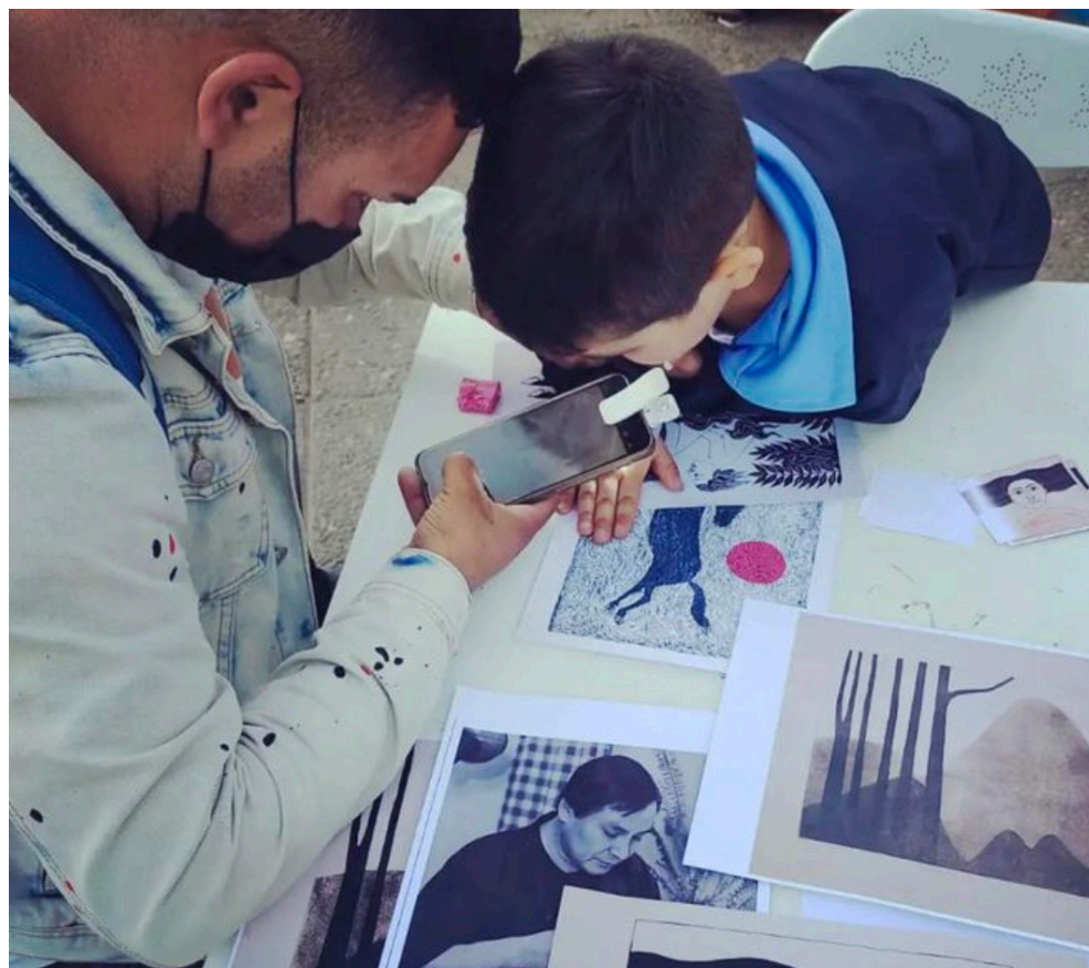
Fig. 11. Padre e hijo observando la obra de Santos Chávez a través de microscopio en la vía pública, Valparaíso, Chile

Por lo demás, el hecho de sacar del contexto museo cerrado las diversas obras de Santos Chávez, ha permitido una lectura distinta de su contenido simbólico por parte de la ciudadanía, ya que se genera un mayor diálogo con el medio, experimentando otras luminosidades de reflejo sobre los soportes, sonidos ambientales cotidianos y comentarios distendidos en torno a lo que se ve, elementos que rompen los cánones del espacio de museo entendido como un lugar de silencio y de contacto inanimado.