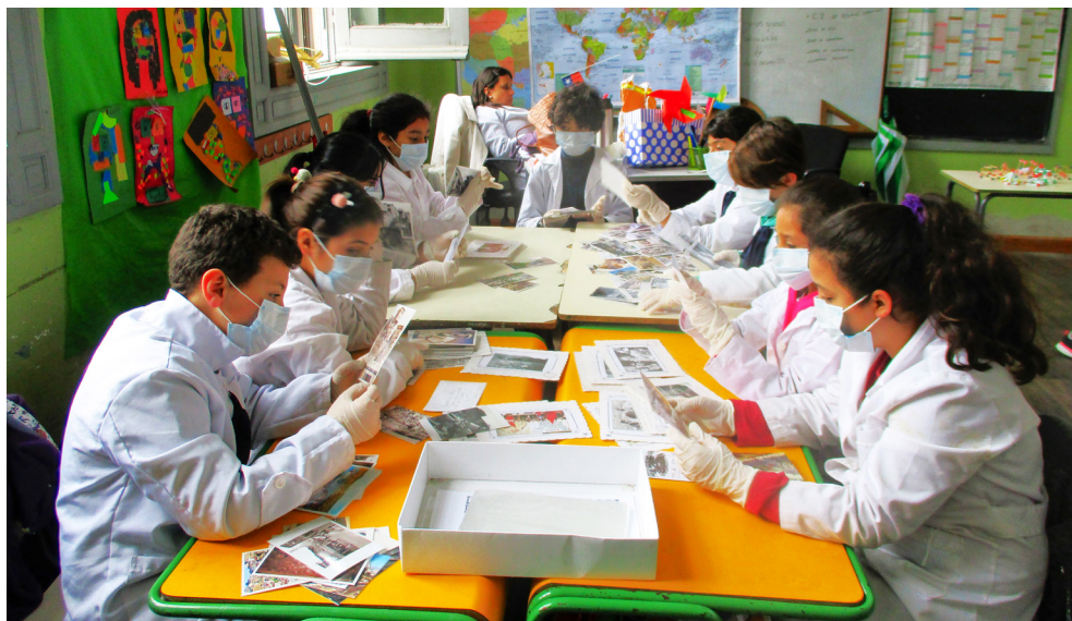
Fig. 2. Intervención documental infantil con alumnos de 5.º Básico de la Escuela República de Chile, Montevideo, Uruguay

proyectar nuevas generaciones con una mayor consciencia histórica, ya que en palabras de Pavez (2016) «el archivo es ambas cosas, conservador de lo viejo e instituyente de lo nuevo. Sin embargo, el archivo implica siempre un concepto de futuro, implica una promesa y una responsabilidad».