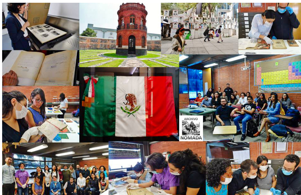
Fig. 5. Experiencias documentales y clases magistrales en Instituto de Antropología e Historia INAH y Escuela Nacional de Conservación y Museología ENCRYM, CDMX, México