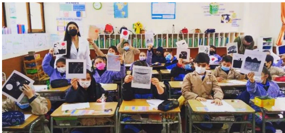
Fig. 9. Taller «Micro Kimün de Santos Chávez» con alumnos de la Escuela Santa Ana, Valparaíso, Chile

Finalmente se aplicaron procedimientos de limpieza mecánica, muestreo de pH y estabilización química de 100 obras.