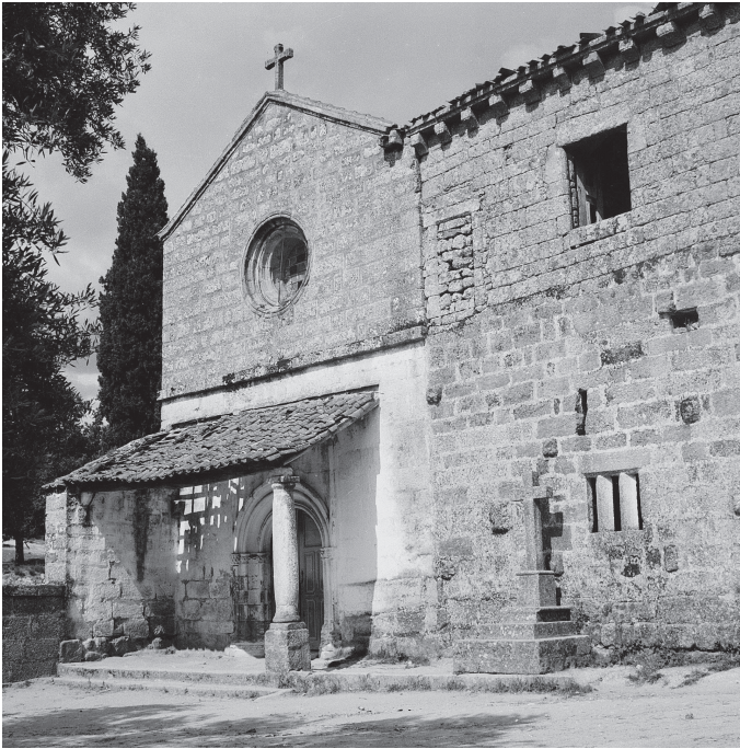
Fig. 5 Aspeto geral da fachada principal da igreja e conventinho de Santa Maria de Cárquere segundo o arquiteto Alberto da Silva Bessa (1949)

1952. Cinco anos depois já tinha sido demolida assim como a parede que separava o cemitério do adro, mas permanecia o fundo caiado que, entretanto, foi removido, numa apologia do granito.