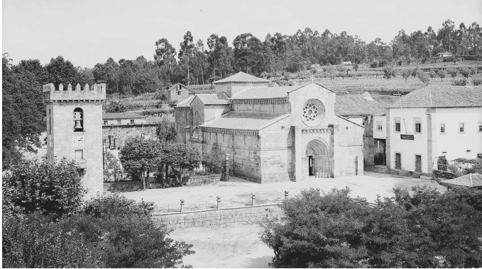
Figs. 1 e 2

Aspetto geral do exterior da Igreja e Mosteiro de Paço de Sousa, antes e depois da intervenção realizada pela DGEMN (na sequência do incêndio que despoletou no início dos trabalhos)