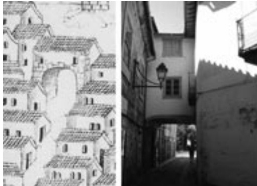
Imagem 5 - ARMAS, Duarte de - Livro das Fortalezas . Lisboa: Edições Inapa, 1997. Pormenor de Castelo de Vide.

Para além destas sacadas e balcões verifica-se por vezes a ligação de duas casas fronteiras pertencentes a um mesmo proprietário por meio de um passadiço sobre a rua. Esta apropriação do espaço público pelo espaço privado resultava nefasta quer pelos inconvenientes para a saúde pública de ruas estreitas, húmidas e mal arejadas, quer pelo risco de propagação de incêndios que destruíam ruas inteiras em pouco tempo.