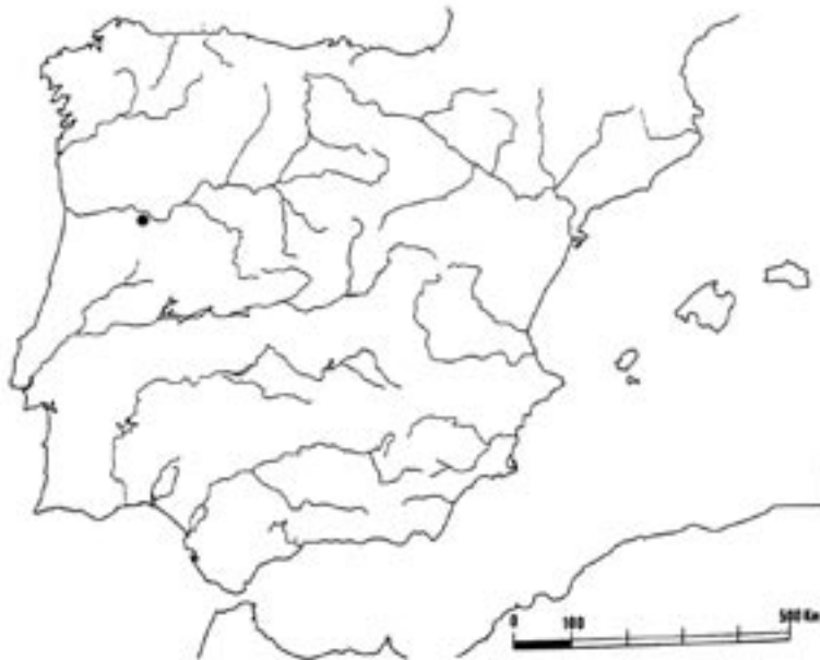
Fig1: Localização do sítio arqueológico de Castanheiro do Vento na Península Ibérica (NE de Portugal, concelho de Vila Nova de Foz Côa)