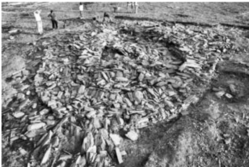
Fig. 4: Vista geral da chamada, provisoriamente, Torre Principal, localizada genericamente a NW da estação arqueológica.

Perto do final dos trabalhos arqueológicos detectou-se uma estrutura circular que denominamos convencionalmente Torre Principal . Consiste numa estrutura monumental localizada na possível área interna do recinto principal. A sua complexidade é grande e encontra-se ainda em processo de escavação. Tem a NO e a SE uma complexa contrafortagem à qual, a SE, se encostam duas estruturas geminadas; estruturas geminadas n.ºs 11 e 13 (Eg11/13).