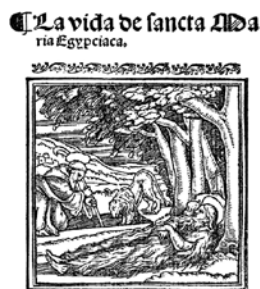
Fig. 8 - Fr. Gonzalo de OCAÑA, O.S.H., La vida y pasión de nuestro señor Jesu Cristo, y las historias de las festividades de su santissima madre con las de los santos apóstoles, mártires, confesores, y vírgines , Zaragoza, Jorge Coci, 26 Abril 1516, [III], f. 168 v.

Fig. 9 - Leyenda de los Santos: que vulgarmente Flos Sanctorum llaman , Sevilla, Juan Gutierrez, 1568, f. 56 d.