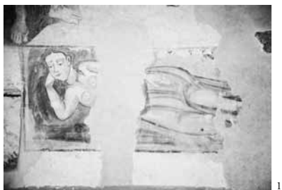
Fig. 1 - Igreja de Nossa Senhora de Balsamão, Chacim (Macedo de Cavaleiros), Mulher deitada