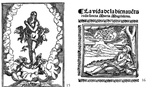
Fig. 16 - Leyenda de los Sanctos: que vulgarmente Flos Sanctorum llaman , Sevilla, Juan Gutierrez, 1568, f. 109 a.