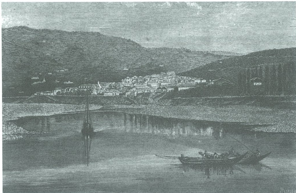
O Douro junto à Régua. Gravura: J. Pedrozo, ca. 1875.

Boletim de Assinatura a enviar ao GEHVID – Faculdade de Letras da Universidade do Porto • Apartado 55038 • 4150 PORTO Codex