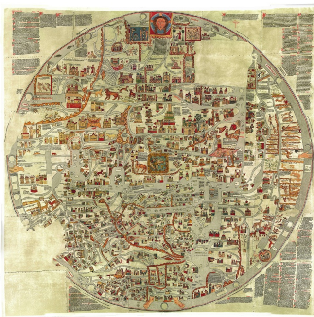
IMAGEM 1 – Fac-símile do mapa-múndi de Ebstorf (c.1236). Coleção privada. Disponível em: http://upload.wikimedia.org/wikipedia/commons/3/39/Ebstorfer-stich2.jpg , acesso em 4 de Janeiro de 2009.