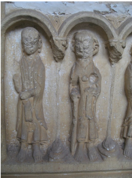
Imagem 3. Pormenor do túmulo de D. Rodrigo Sanches. Figura com vieira ao peito.