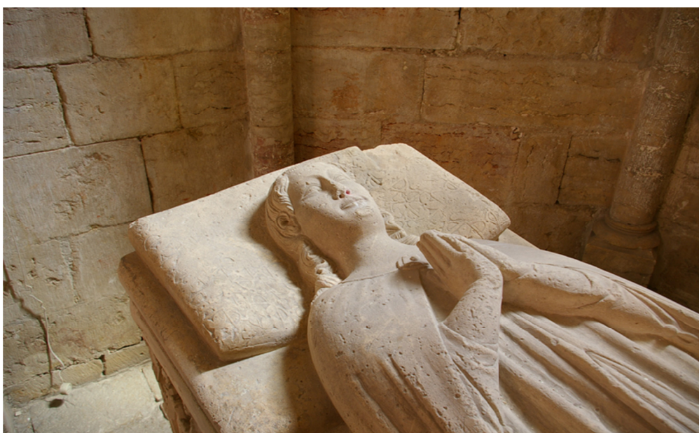
José Custódio Vieira da Silva (Copyright Imago), Túmulo do infante D. Dinis. Mosteiro de S. Dinis, Odivelas. Pormenor