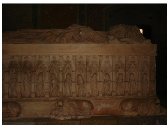
Imagem 9. Facial lateral do arcaz tumular de D. Gonçalo Pereira.