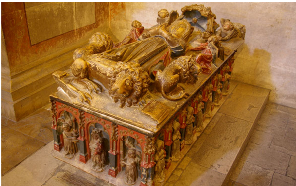
José Custódio Vieira da Silva (Copyright Imago), Túmulo da infanta D. Isabel. Mosteiro de S. Clara a Nova, Coimbra.