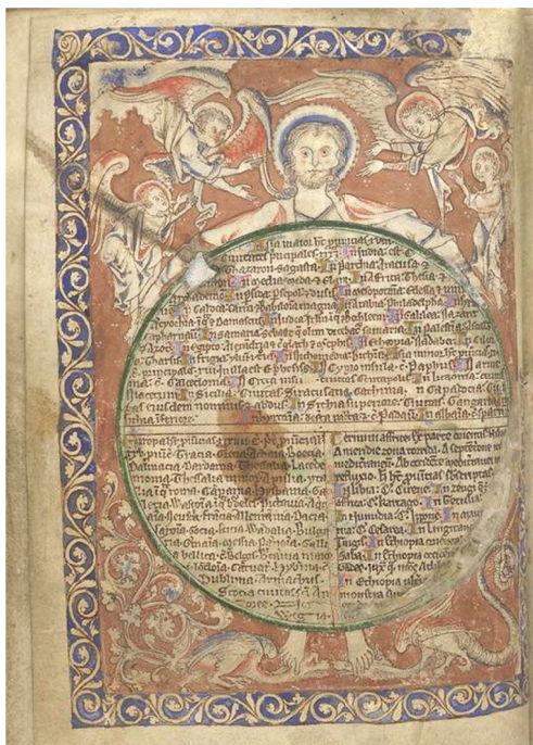
IMAGEM 3 – Mapa do Saltério (c. 1260). British Library, Add. MS. 28681, fol. 9v. Disponível em: http://ogimages.bl.uk/images/011/011ADD000028681U00009V00[SVC2].jpg , acesso em 4 de Janeiro de 2009.