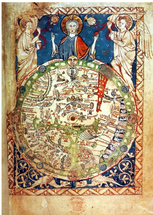
IMAGEM 2 – Mapa do Saltério (c. 1260). British Library, Add. MS. 28681, fol. 9r. Disponível em: http://commons.wikimedia.org/wiki/File:Psalter_world_map.jpg , acesso em 4 de Janeiro de 2009.