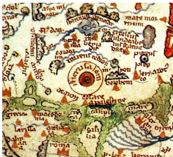
IMAGEM 6 – Mapa do Saltério (c. 1260): detalhamento da cidade de Jerusalém.