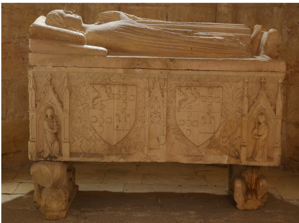
Túmulo do infante D. Dinis. Mosteiro de S. Dinis, Odive- las.

Infelizmente, a História frustrou os esforços de D. Dinis, transtornando todos os seus bons propósitos: o conflito com o Infante D. Afonso, que envolverá também a rainha Isabel, tornará vãs as tentativas ensaiadas ao longo daquele mesmo ano de 1318.