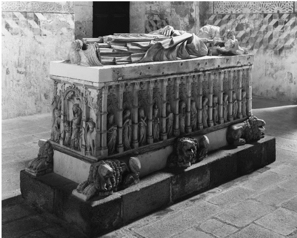
Imagem 5. Imagem do túmulo de D. Gonçalo Pereira.