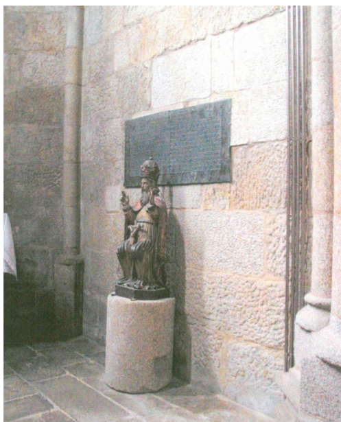
Imagem 11. Vista parcial da Capela do Ferro onde se encontra a lâmina sepulcral.