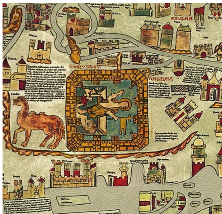
IMAGEM 5 – Mapa de Ebstorf (c. 1236): detalhamento da cidade de Jerusalém.