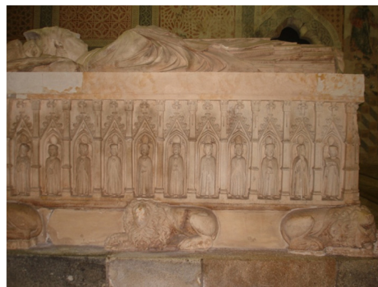
Imagem 8. Facial lateral do arcaz tumular de D. Gonçalo Pereira.