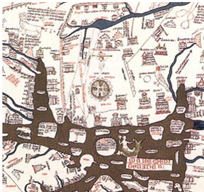
IMAGEM 7 – Detalhamento da cidade de Jerusalém presente no fac-símile do mapa-múndi de Hereford de Konrad Miller (1896). Documento integral disponível em: http://nuweb.neu.edu/kkelly/med/hereford.html , acesso em 4 de Janeiro de 2009.