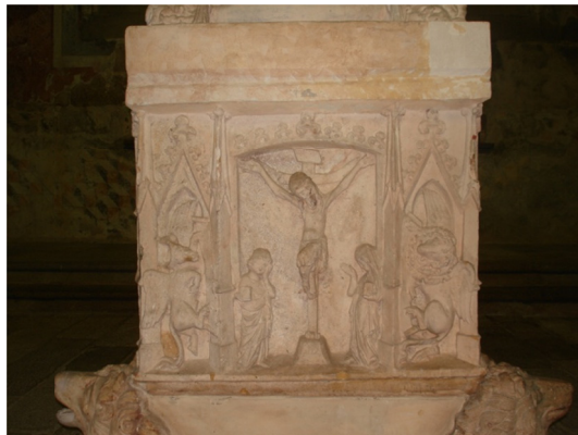
Imagem 6. Facial da cabeça do arcaz tumular de D. Gonçalo Pereira.