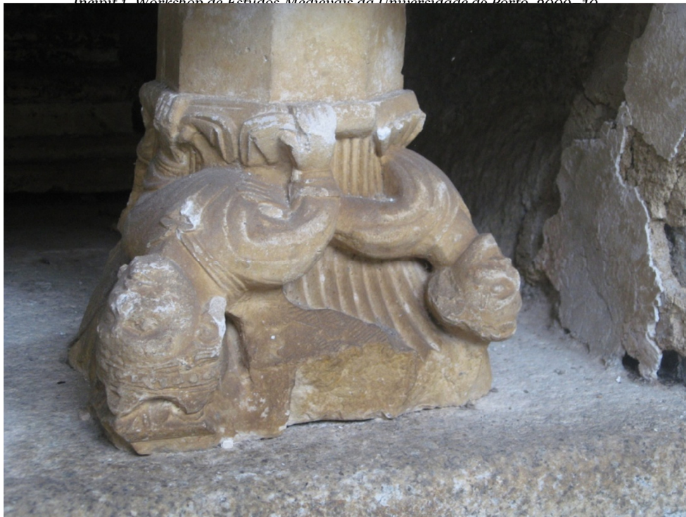
Imagem 4. Pormenor do túmulo de D. Rodrigo Sanches. Capitel gótico reaproveitado como pé.