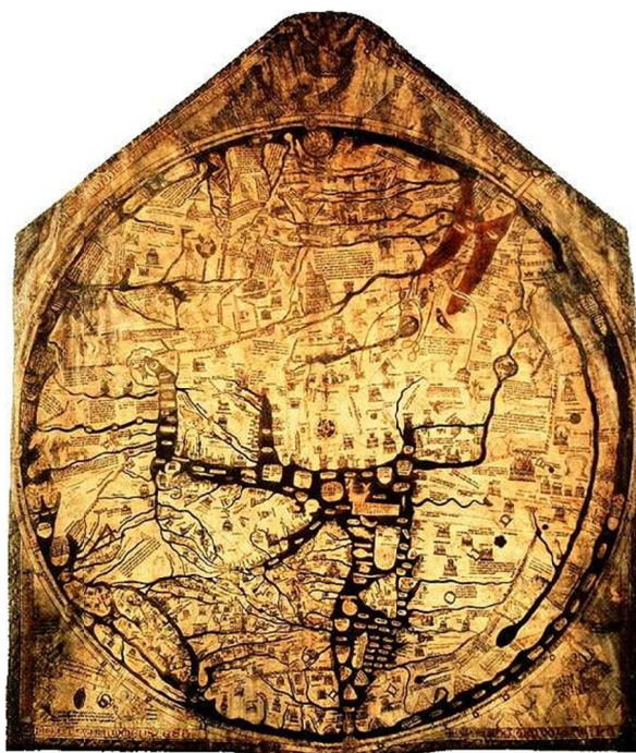
IMAGEM 4 – Mapa-múndi de Hereford (c. 1290). Manuscrito em exposição permanente na Catedral de Hereford. Disponível em: http://en.wikipedia.org/wiki/File:Hereford_Mappa_Mundi_1300.jpg , acesso em 4 de Janeiro de 2009.